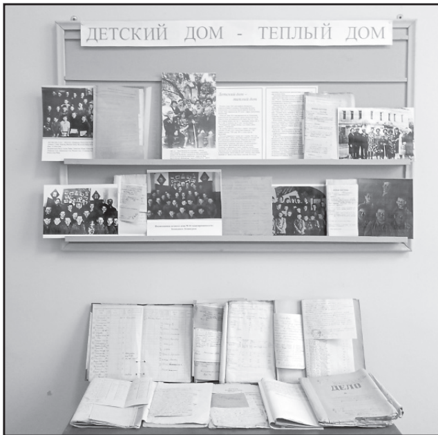
Выставка в Ильинском архиве.

В архивном отделе администрации Ильинского муниципального района представлена документальная выставка «Детский дом – теплый дом». Выставка посвящена истории детского дома № 16, эвакуированного из блокадного Ленинграда и размещенного в с. Ильинском.