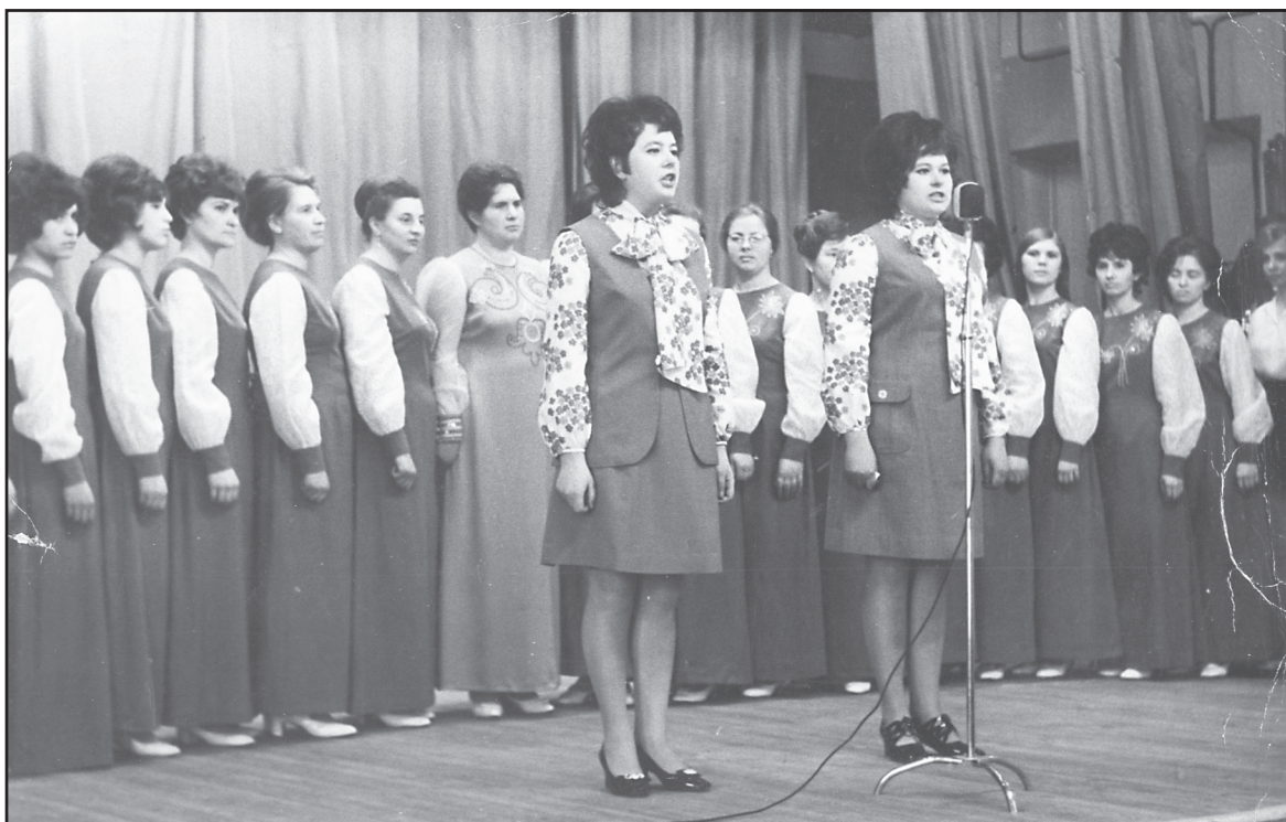
Заключительный концерт художественной самодеятельности учреждений здравоохранения Ивановской области, 1974 год.