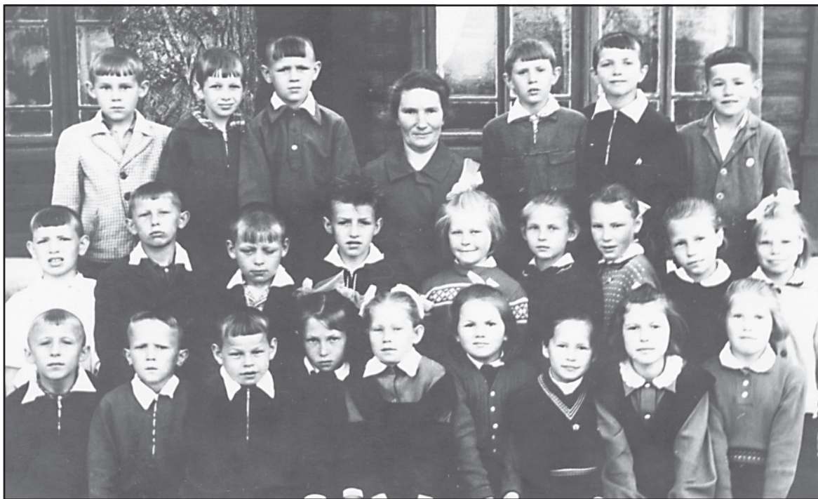
Аньковская школа, 2 класс, 1963 год.