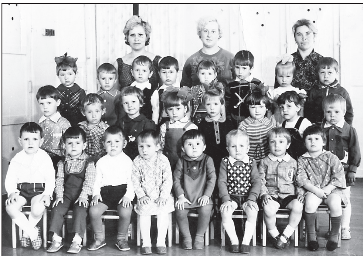
Воспитанники Ильинского детского сада, 1984 год.