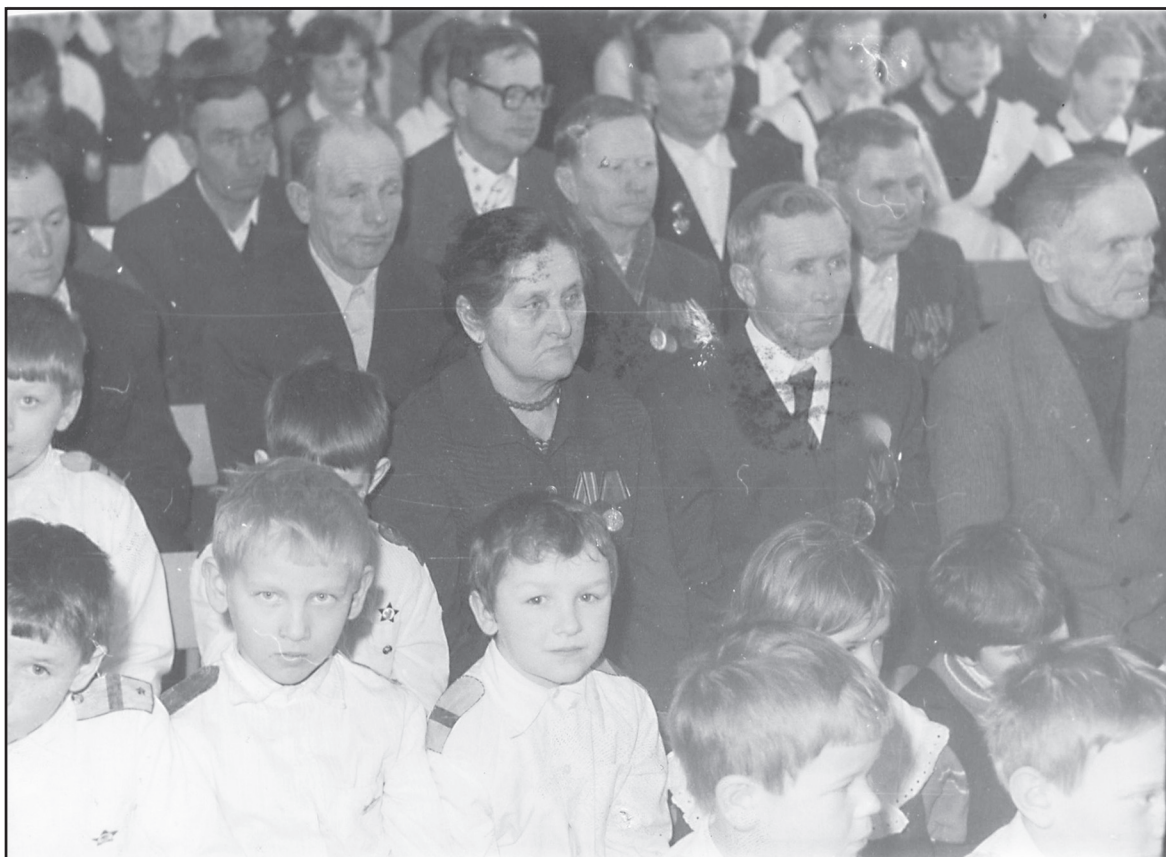
Встреча с ветеранами Великой Отечественной войны, с. Игрищи, 1980-е годы.