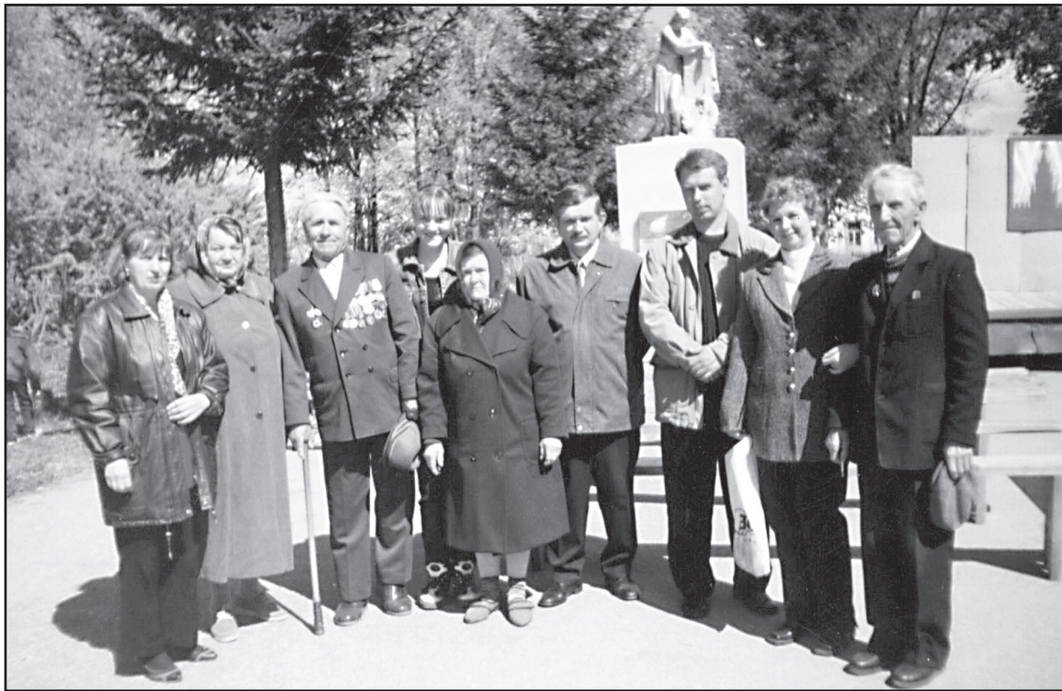
С ветеранами Великой Отечественной войны после митинга, начало 1980-х годов.