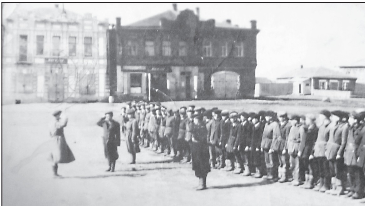
Проводы в армию, с. Аньково.