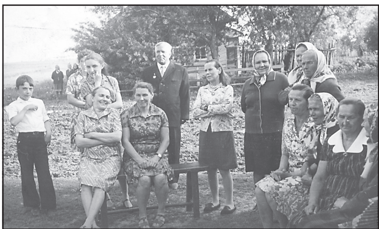
Деревенские посиделки, д. Полянки.