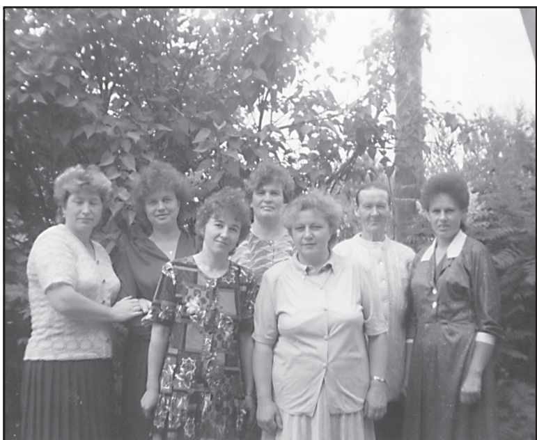
Специалисты бухгалтерии совхоза, с. Ивашево, 1997 год.