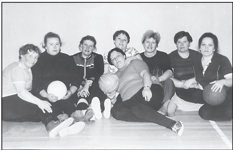
Группа здоровья, минутка на передышку, 1988 год.