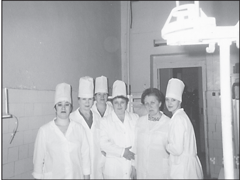
Сотрудники хирургического отделения Ильинской ЦРБ. Как молоды мы были,...