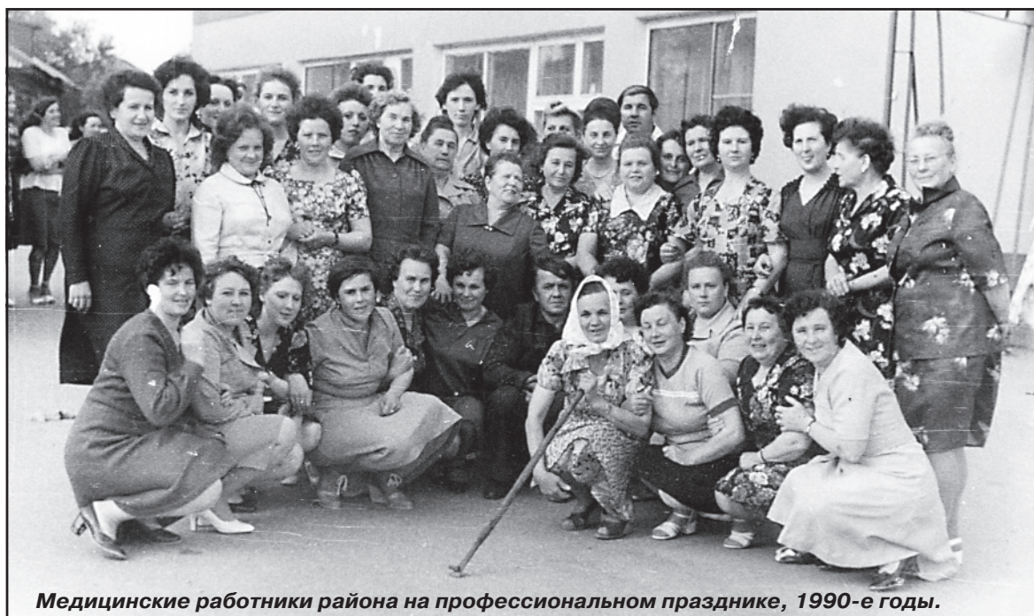
Медицинские работники района на профессиональном празднике, 1990-е годы.