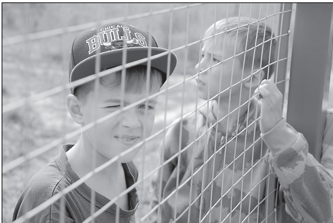
Летняя оздоровительная кампания может так и не начаться.