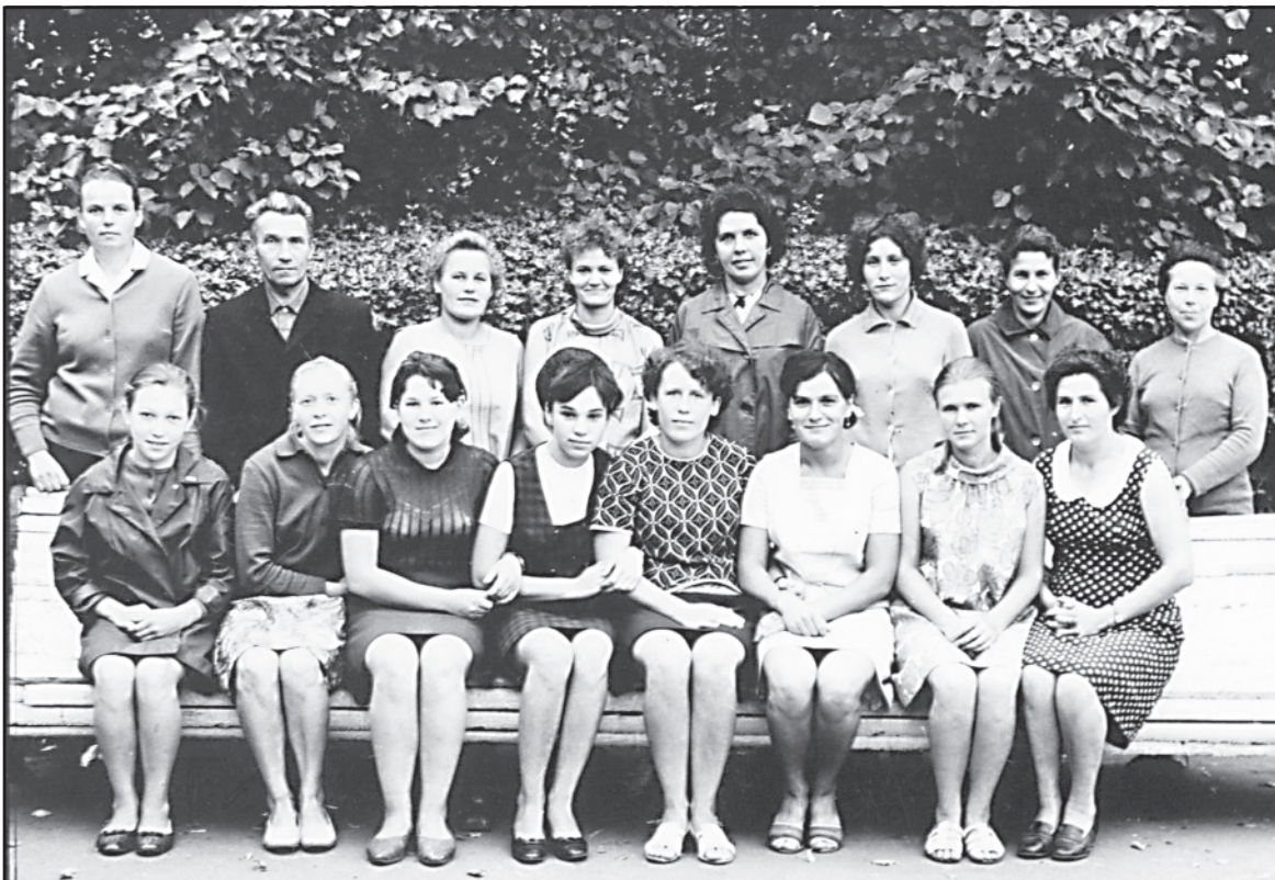
Работники Аньковского КБО на экскурсии в Москве, август 1970 год.