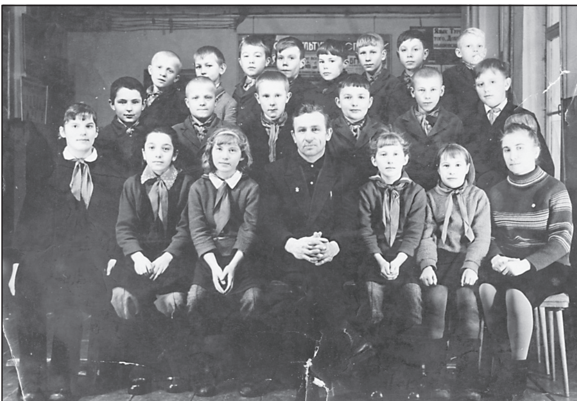
Учащиеся Исаевской школы, 1960-е годы.