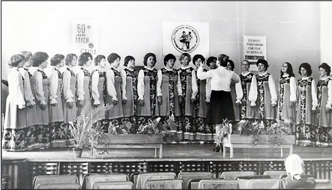
Хор Ильинской ЦРБ на областном смотре художественной самодеятельности, 1978 год.