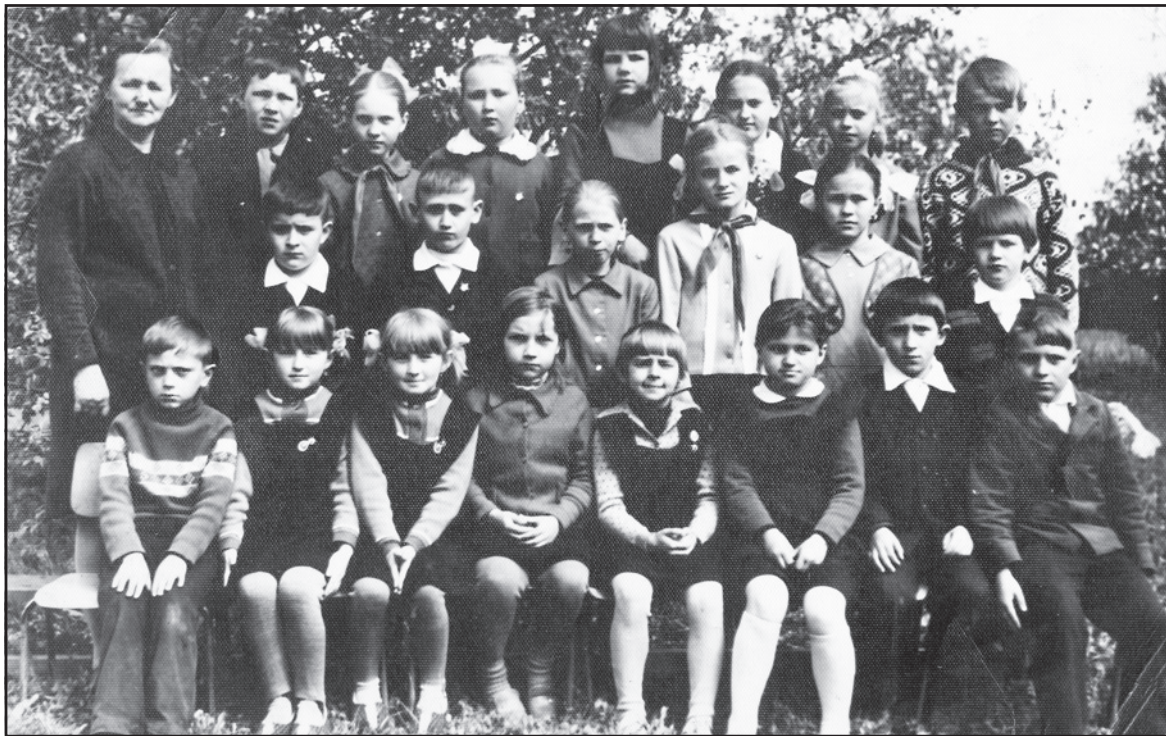
Учащиеся Исаевской школы, 1970-е годы.