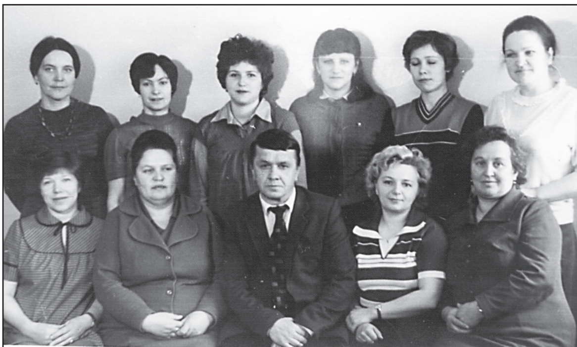
Коллектив «Сельхозтехники», 1986 год.