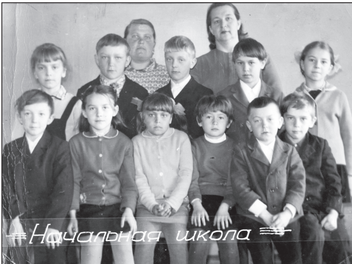
Учащиеся Мало-Денисовской школы, 1-3 классы, 1974 год.