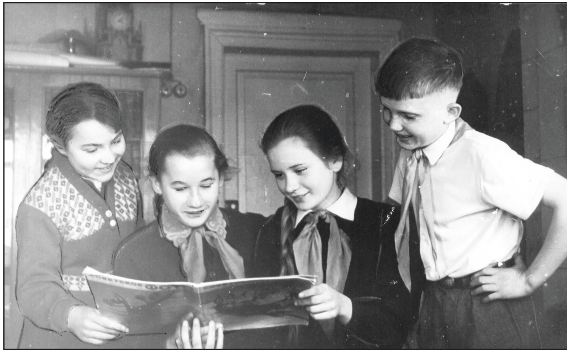
Пионеры, 1964 год.