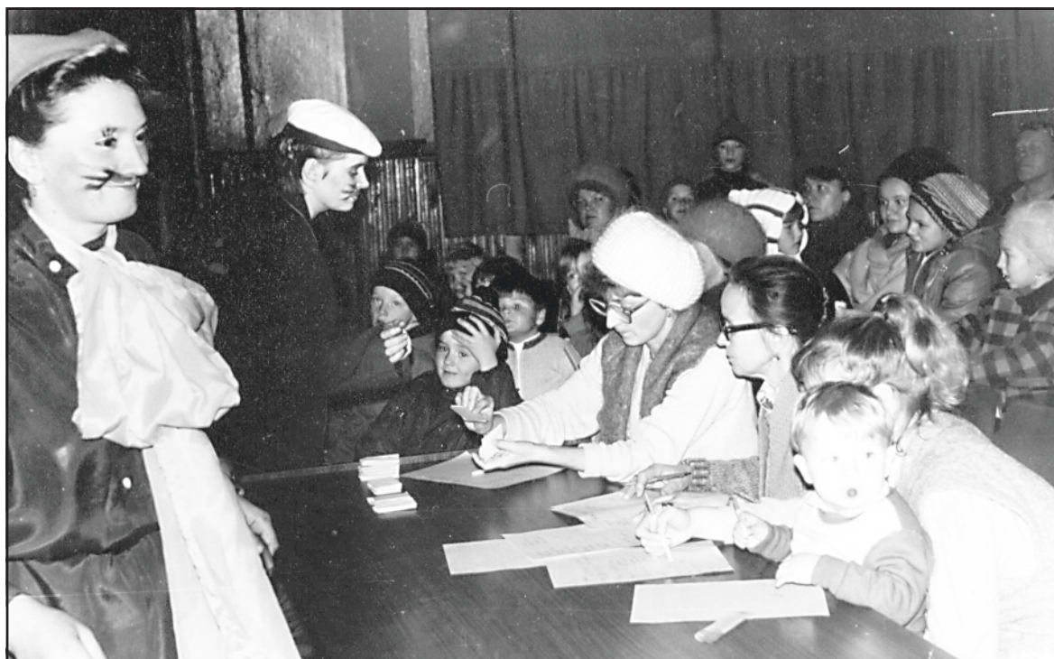
Кис-парад, Ильинский ДК, 1992 год.