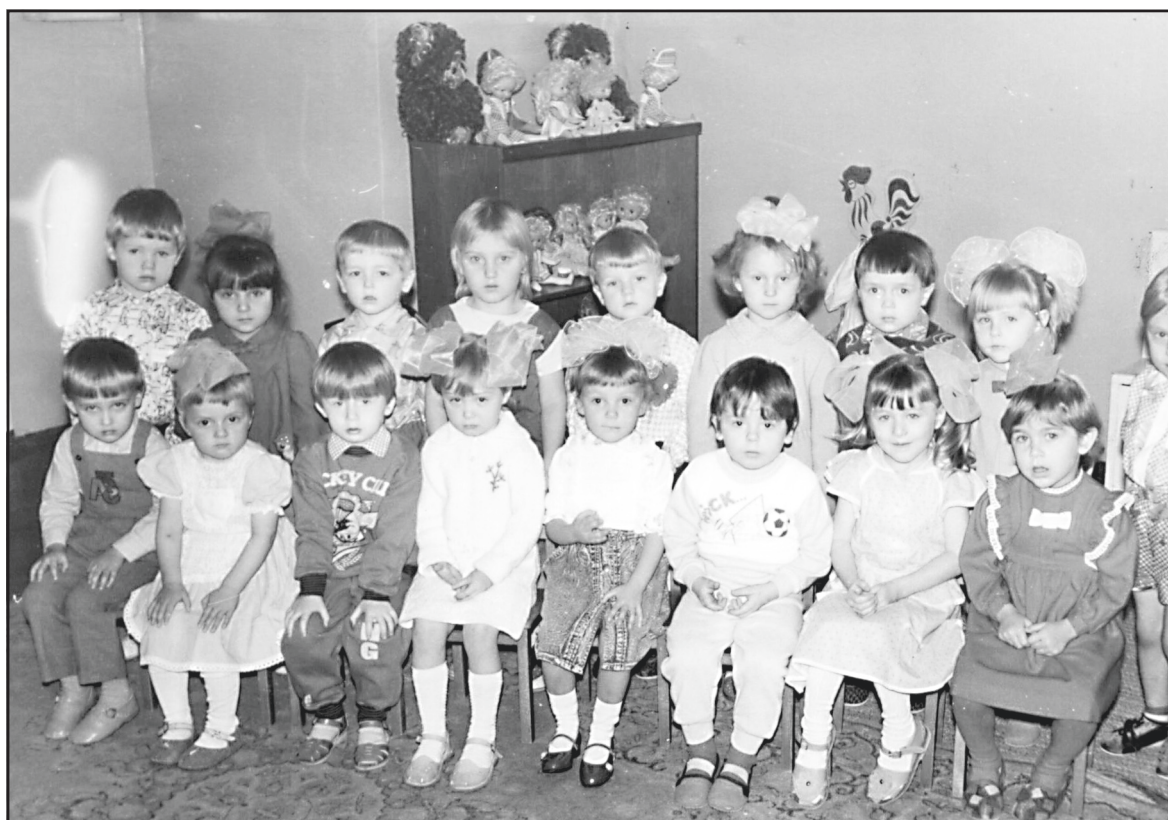
Воспитанники Ильинского детского сада, 1993 год.