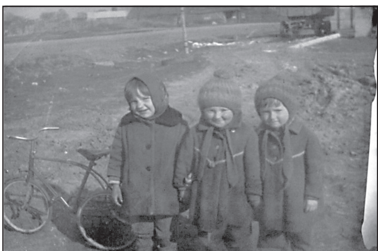
Подружки, д. Осипово, 1972 год.