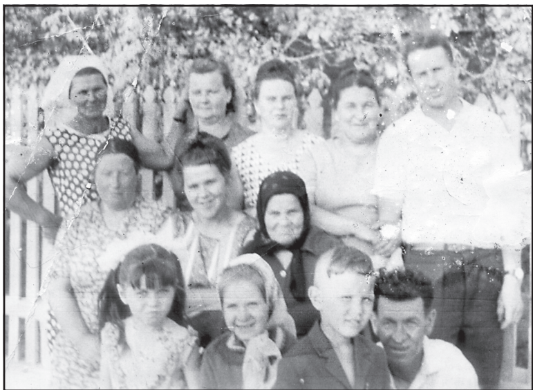
Престольный праздник, д. Скоково, 1960-е годы.