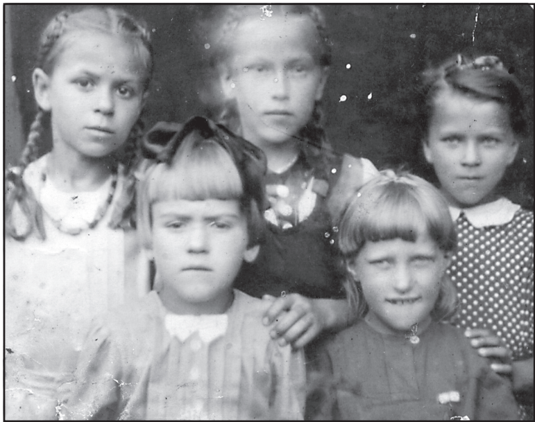
Встреча сестрёнок, д. Осветино, 1940 год.