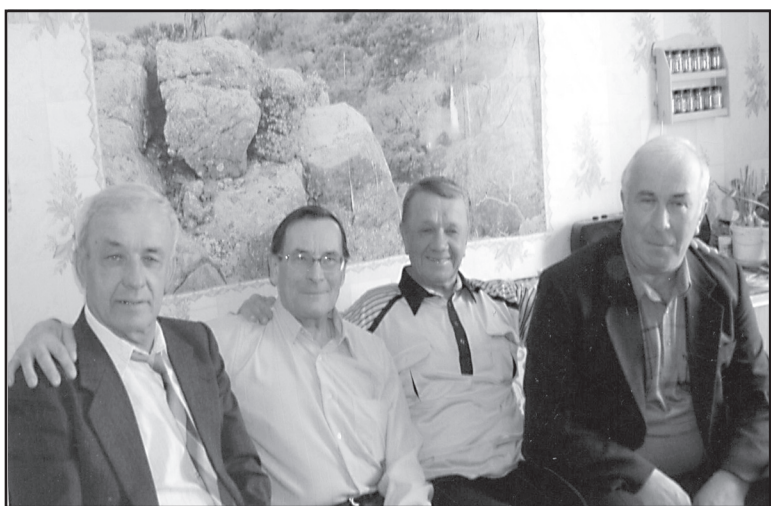
Друзья, п. Ильинское, 2006 год.