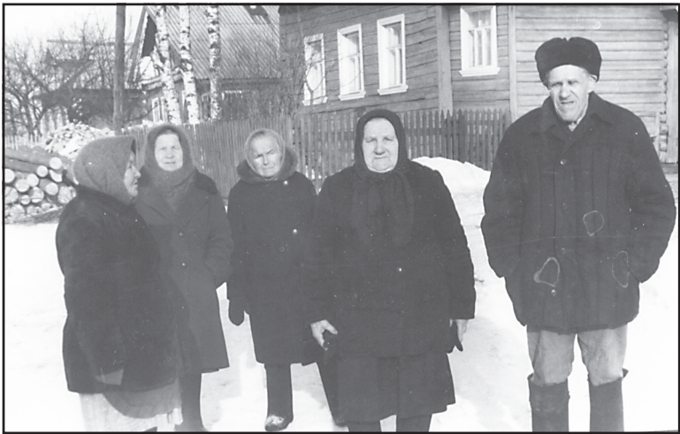
Зимняя прогулка, д. Полянки, 1980-е годы.