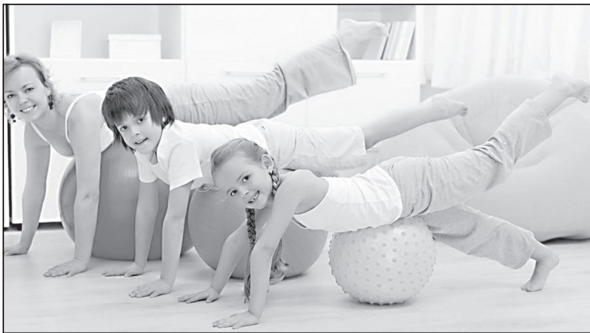
Материал подготовила И. БАРИНОВА.

Сядьте удобно. Положите левую лодыжку поверх правой. Перекрестите руки на груди - левая поверх правой, схватите их в замок, переплетая пальцы между собой, и положите их на груди. Посидите в этой позе минуту, делая глубокие вдохи, закрыв глаза и прижав язык к твердому небу. Разъедините ноги, сомкните кончики пальцев между собой и дышите глубоко в течение другой минуты.