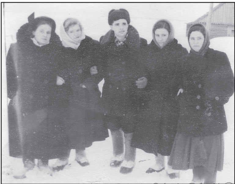
Осветинская молодёжь, 1958 год.