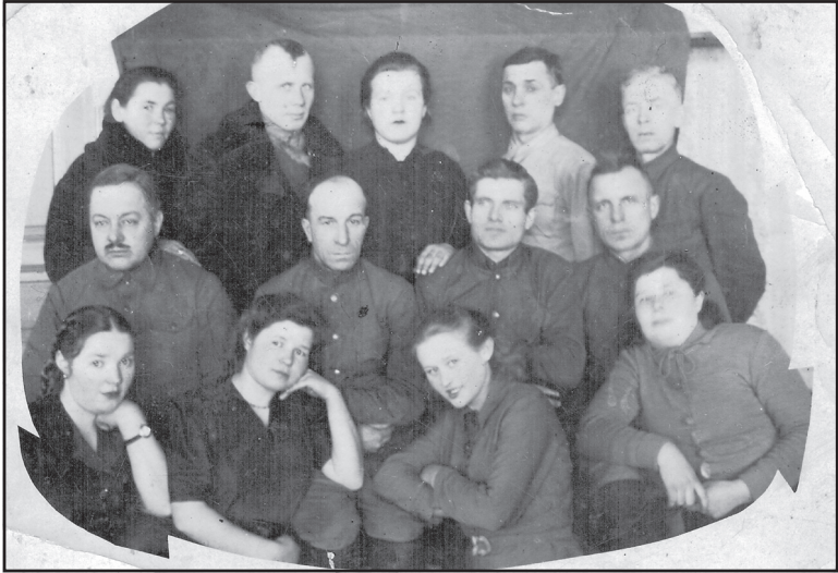
Сотрудники Ильинского промкомбината, 1945-1946 годы.