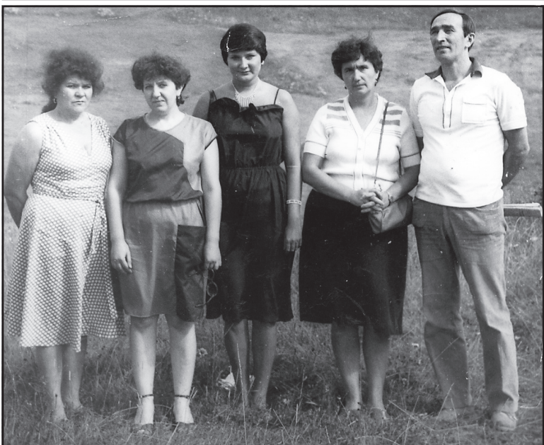
На отдыхе в Грузии жительницы д. Скоково, 1984 год.