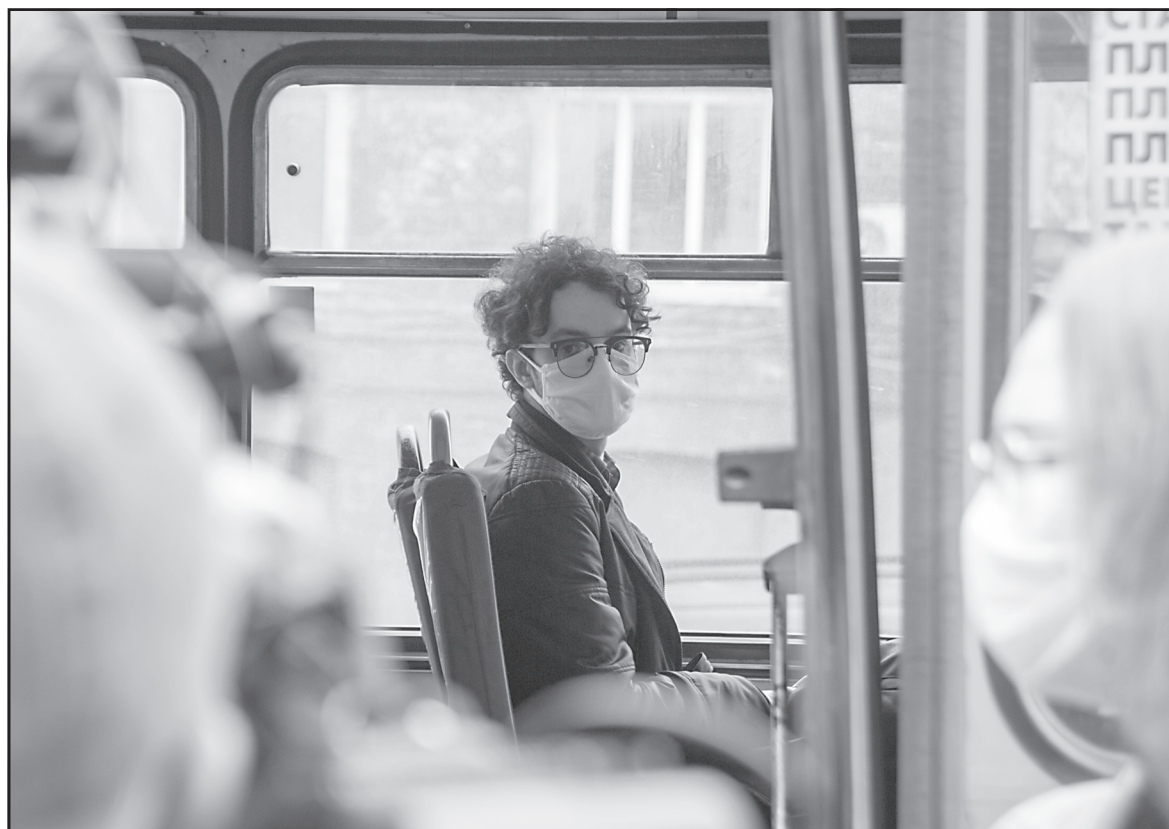
Число заболевших вновь растет, а пассажиры в масках попадают всё реже.