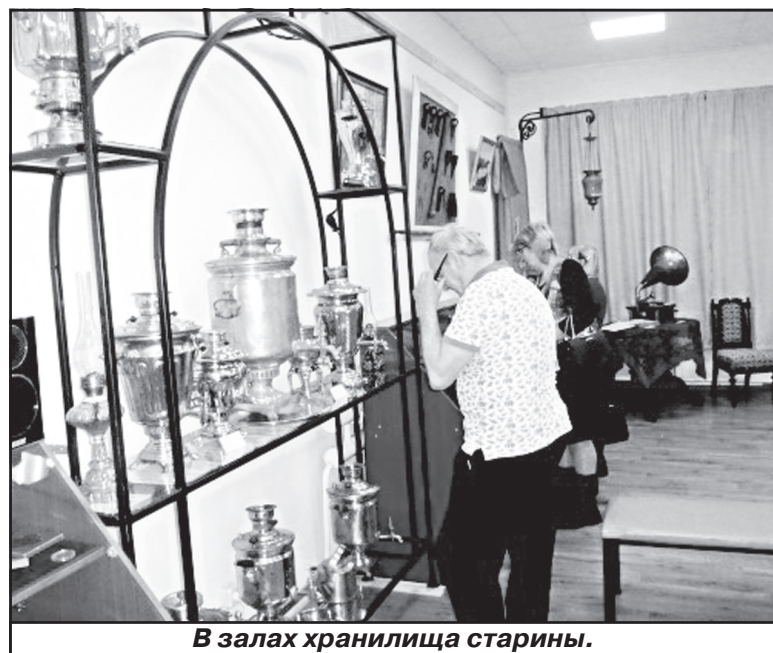
В залах хранилища старины.