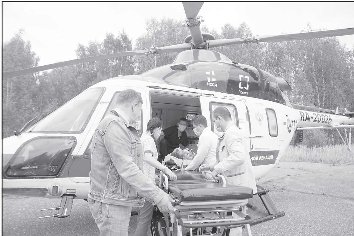
«Ансат» можно сравнить с реанимобилем класса «С», но скорость, конечно, выше.

Особенно важна скорость, по словам Лесных, для пациен-