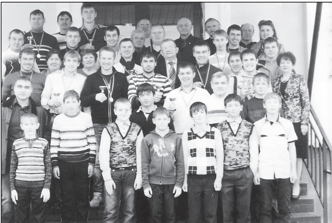
Награждение Ильинской футбольной команды (чемпионы области по футболу, II лига), 2011 год.