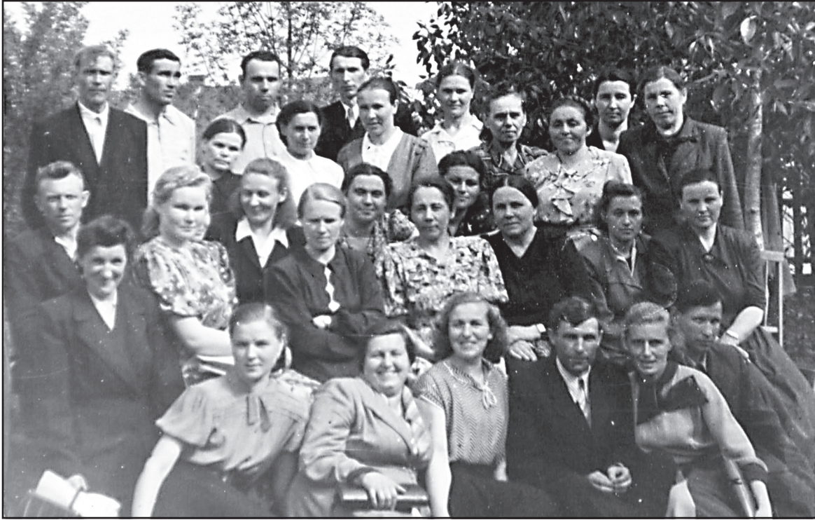
Учителя начальных классов Ильинского района, 1947 год.