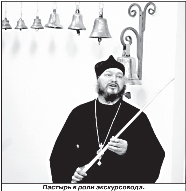
Пастырь в роли экскурсовода.

(ОЧЕРК О ПОДВИЖНИКЕ КРАЕВЕДЕНИЯ И ДЕЛАХ ЕГО)