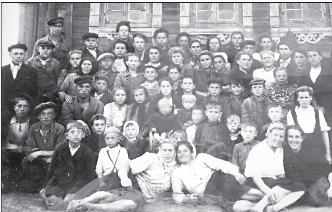
Жители деревни Санниково, 1947 год.