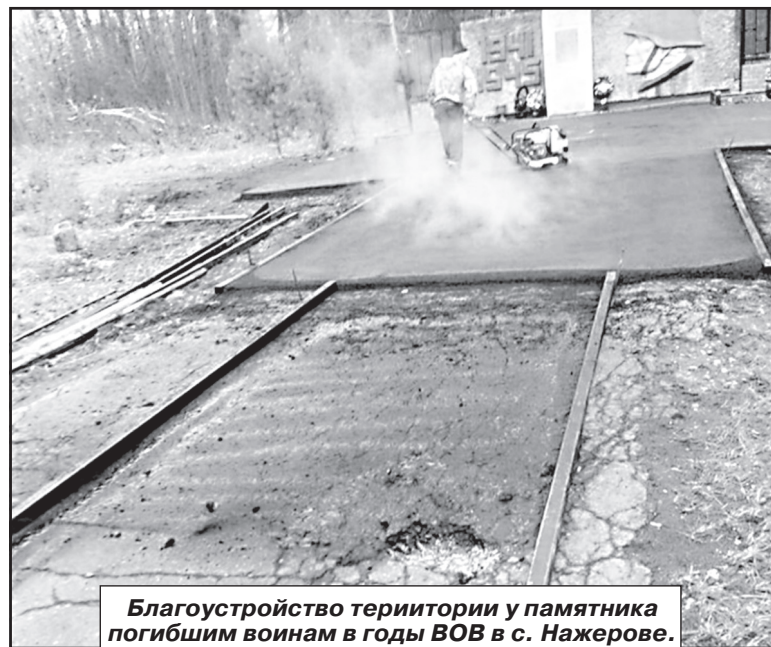
Благоустройство территории у памятника погибшим воинам в годы ВОВ в с. Нажерове.

В 2020 году администрацией Ивашевского сельского поселения было подготовлено и отправлено в департамент сельского хозяйства и продовольствия Ивановской области четыре заявки для участия в конкурсном отборе проектов, основанных на инициативах местных граждан, по программе «Комплексное развитие сельских территорий». В итоге: все четыре проекта были одобрены. Один из них «Создание и обустройство спортивной площадки в с. Ивашеве». На реализацию проекта департамент сельского хозяйства и продовольствия на-