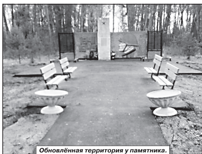
Обновлённая территория у памятника.