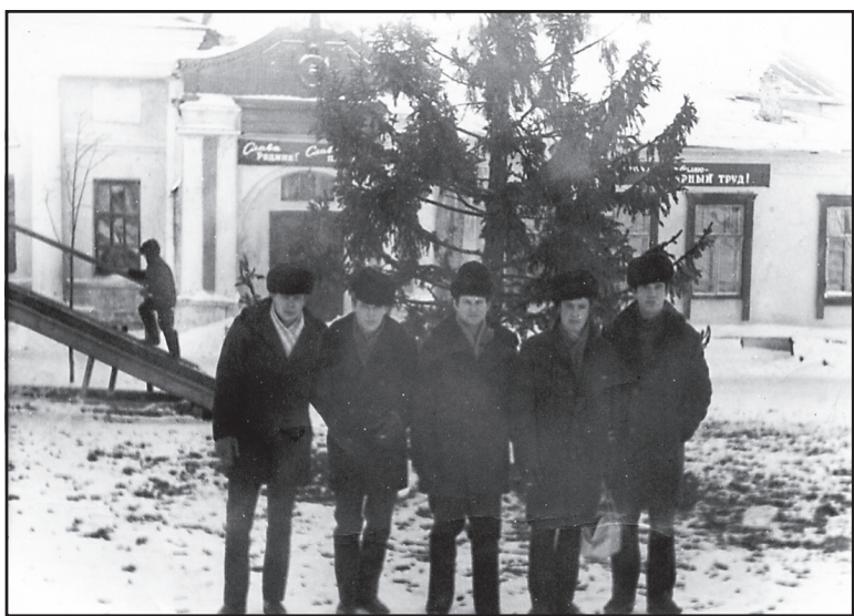
Ильинские парни около старого дома культуры, 1966 год.