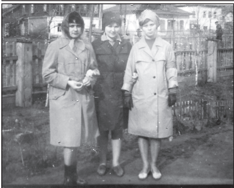
Подруги, п. Ильинское, 1967 год.