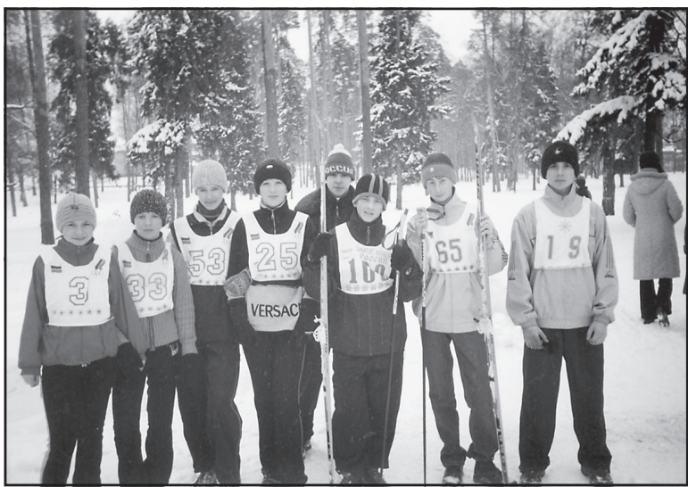
На лыжных соревнованиях команда Ильинской средней школы, 2004 год.