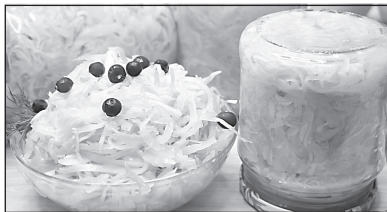
Материал подготовила И. БАРИНОВА.