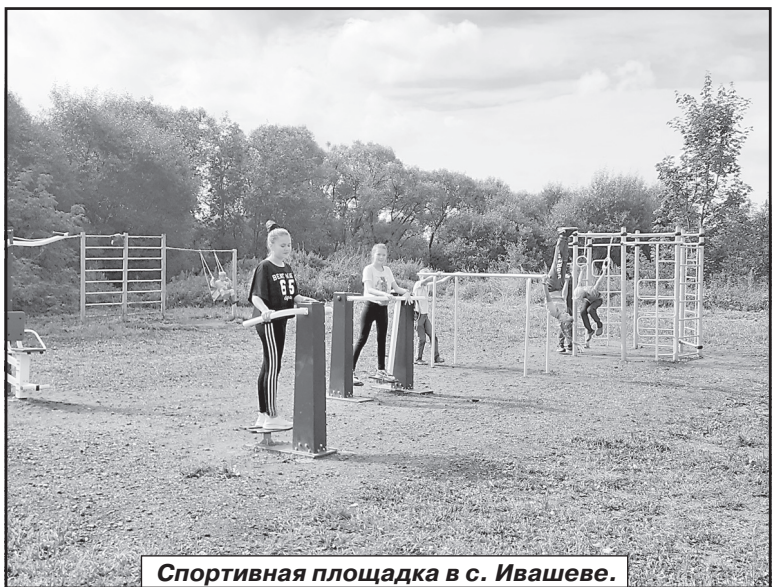
Спортивная площадка в с. Ивашеве.

Благодаря активности жителей Ивановской области (и Ивановского района в том числе) то, что казалось на первый взгляд невозможным, стало реальным. Только вместе, общими усилиями мы сможем сделать наши сёла и деревни краше, уютнее и благоустроеннее.