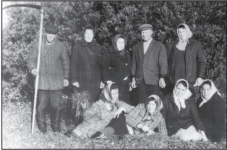
На покосе работники ЦРБ, 1980 год.