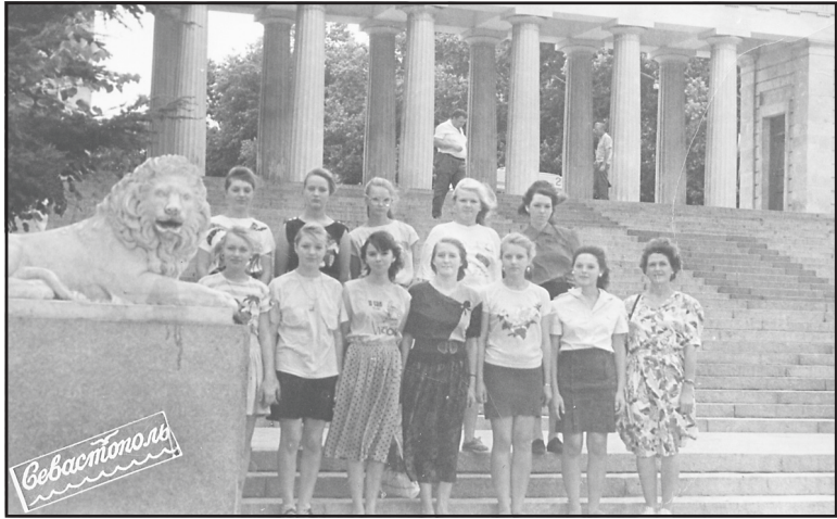
Учащиеся Назеровской школы на экскурсии в Севастополе, 1994 год.