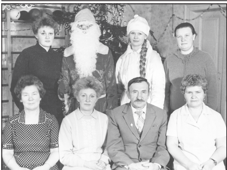
Коллектив учителей Кулачевской школы, 1986-1987 годы.