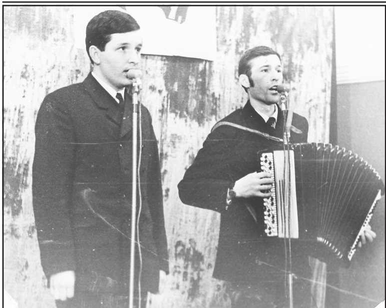
Участники художественной самодеятельности Аньковского ДК.