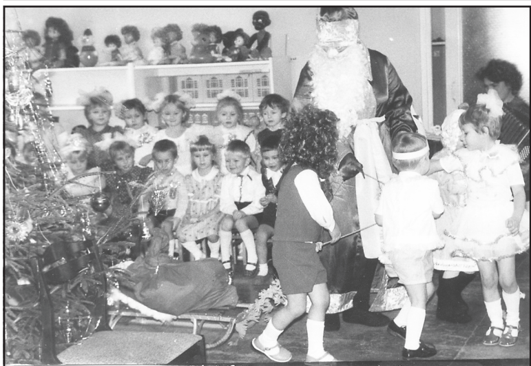
Дед Мороз подарки привёз! Ильинский детский сад, 1986-1987 годы.