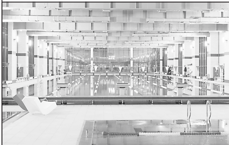
По материалам официального сайта Правительства Ивановской области.

Губернатор подчеркнул, создание базовых условий для жизни, чтобы людям хотелось жить в Ивановской области так же важно, как создание рабочих мест, развитие экономики. По словам Станислава Воскресенского, развитие физической культуры и спорта – одно из таких важных условий.