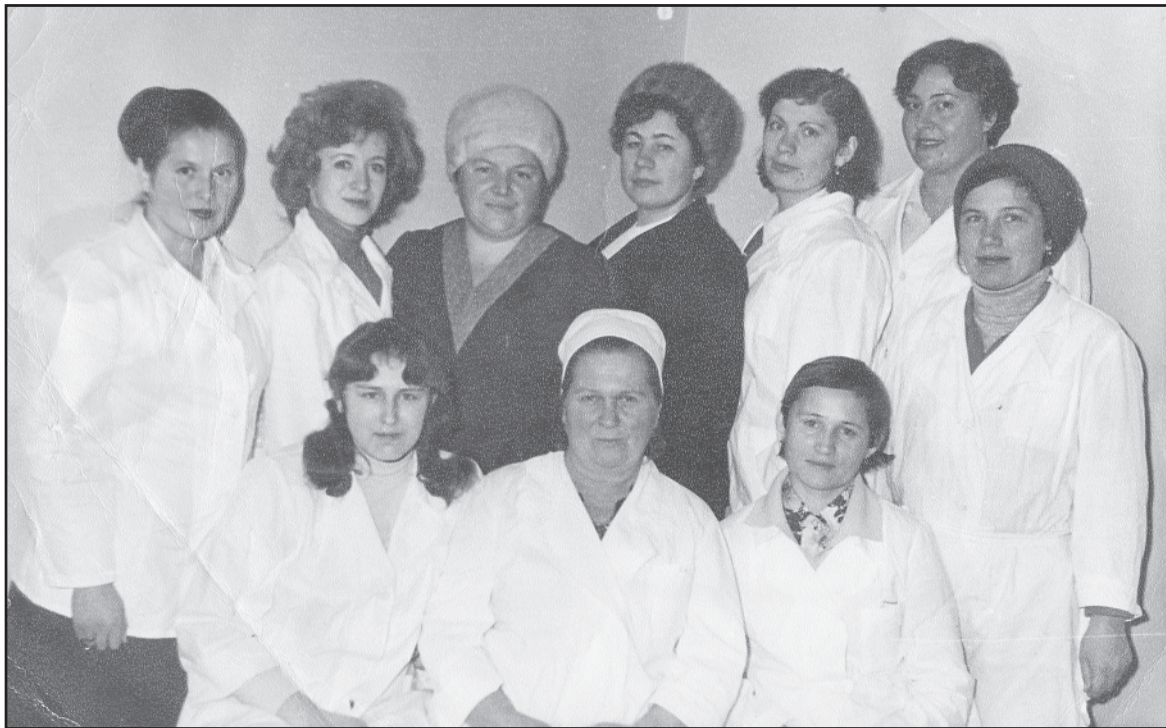
Работники РАЙПО после выездной торговли, 1980-е годы.