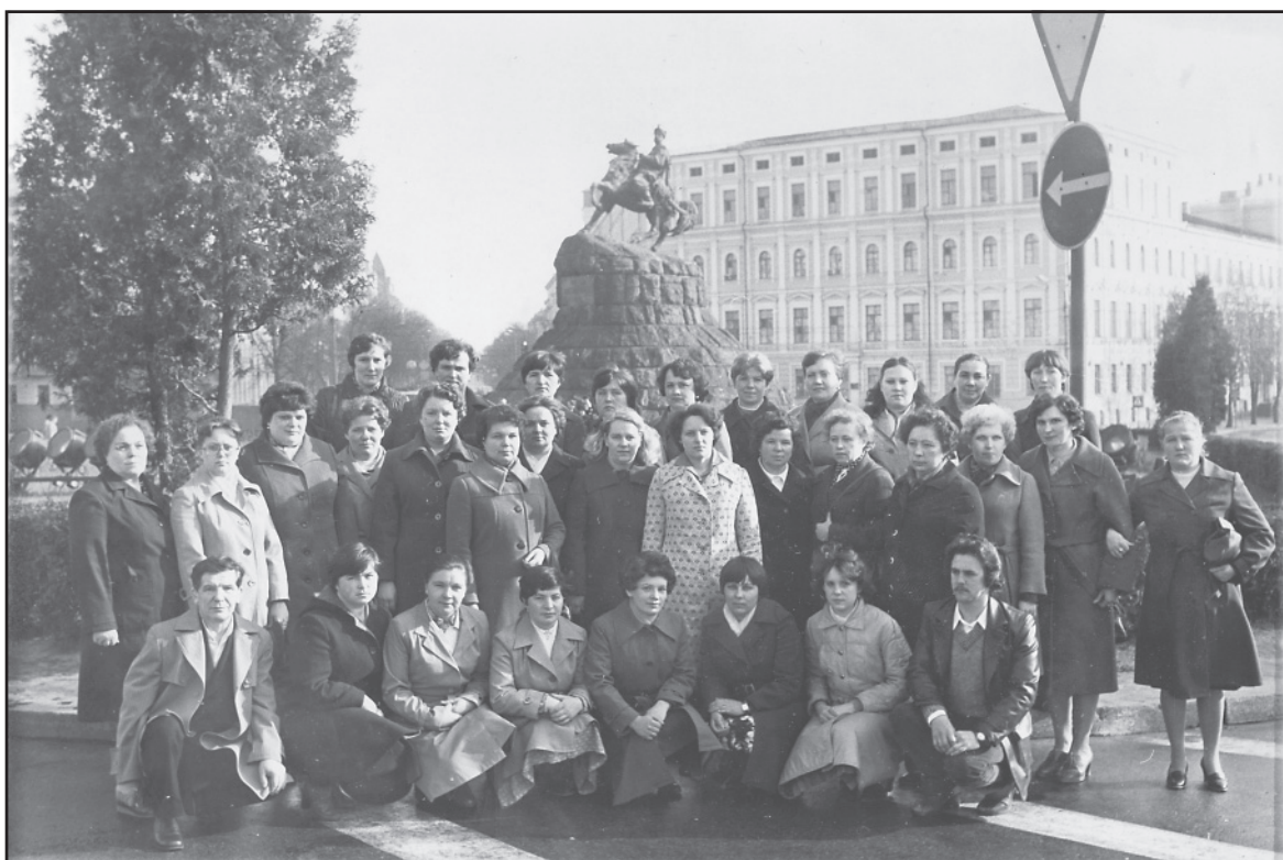
Делегация Ильинского района в туристической поездке в Киев, 1983 год.