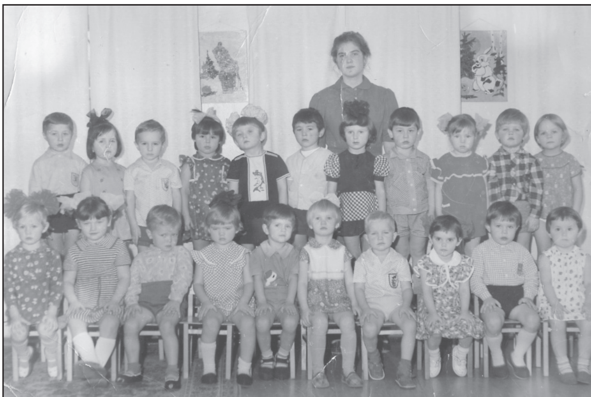
Воспитанники Ильинского детского сада, 1983-1984 годы.