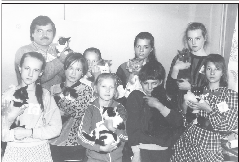
Кис-Парад в Ильинском ДК, 1991-1992 годы.

Президент России в своем послании Федеральному собранию четко обозначил: «Здоровье нации, обеспечение социальной защиты людей старшего поколения – приоритетные направления государственной политики». Уже сейчас число пожилых людей в России практически составляет четверть населения страны.