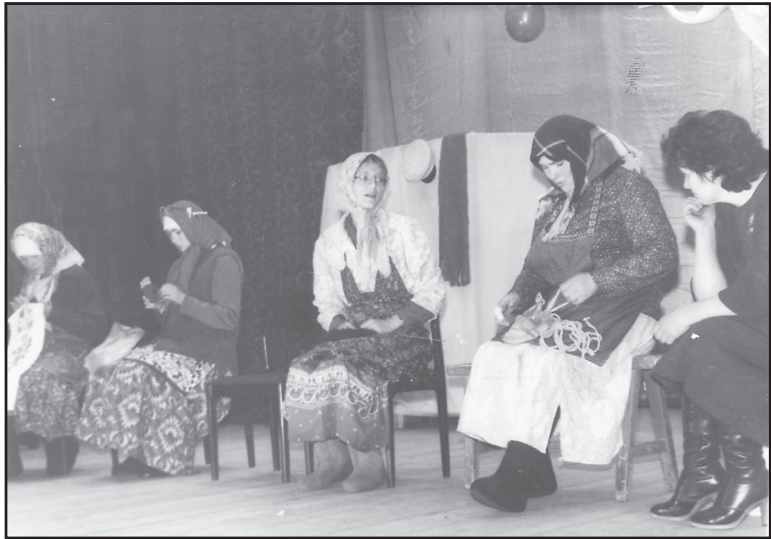
Коллектив Гарского ДК с постановкой «Семь мисок, семь ложек».