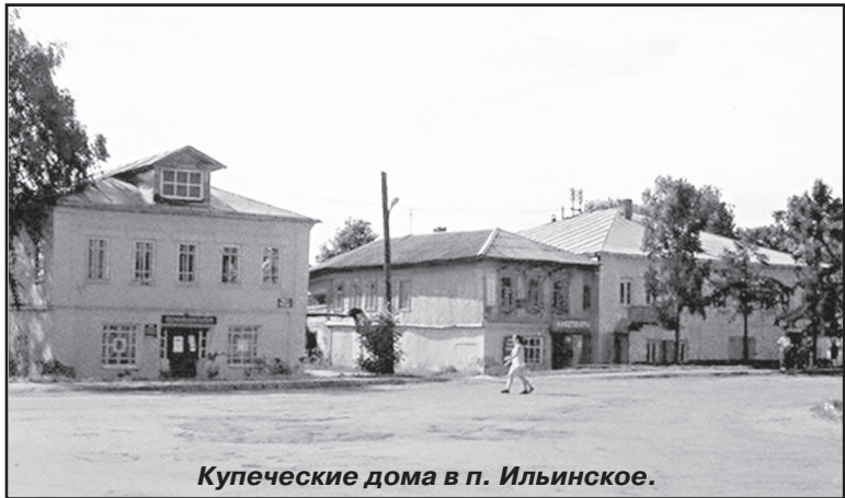
Купеческие дома в п. Ильинское.

Продолжение читайте в следующем номере. Материал подготовила Л. ЛУНЁВА.