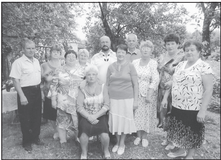
Встреча выпускников Ильинской средней школы, 45 лет спустя, 2013-2014 годы.