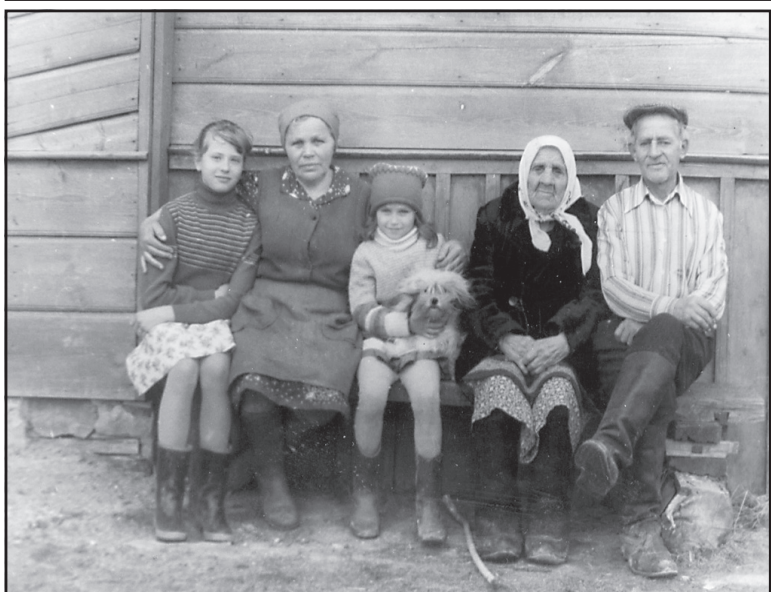
Родственники, д. Шумятино, 1980 год.