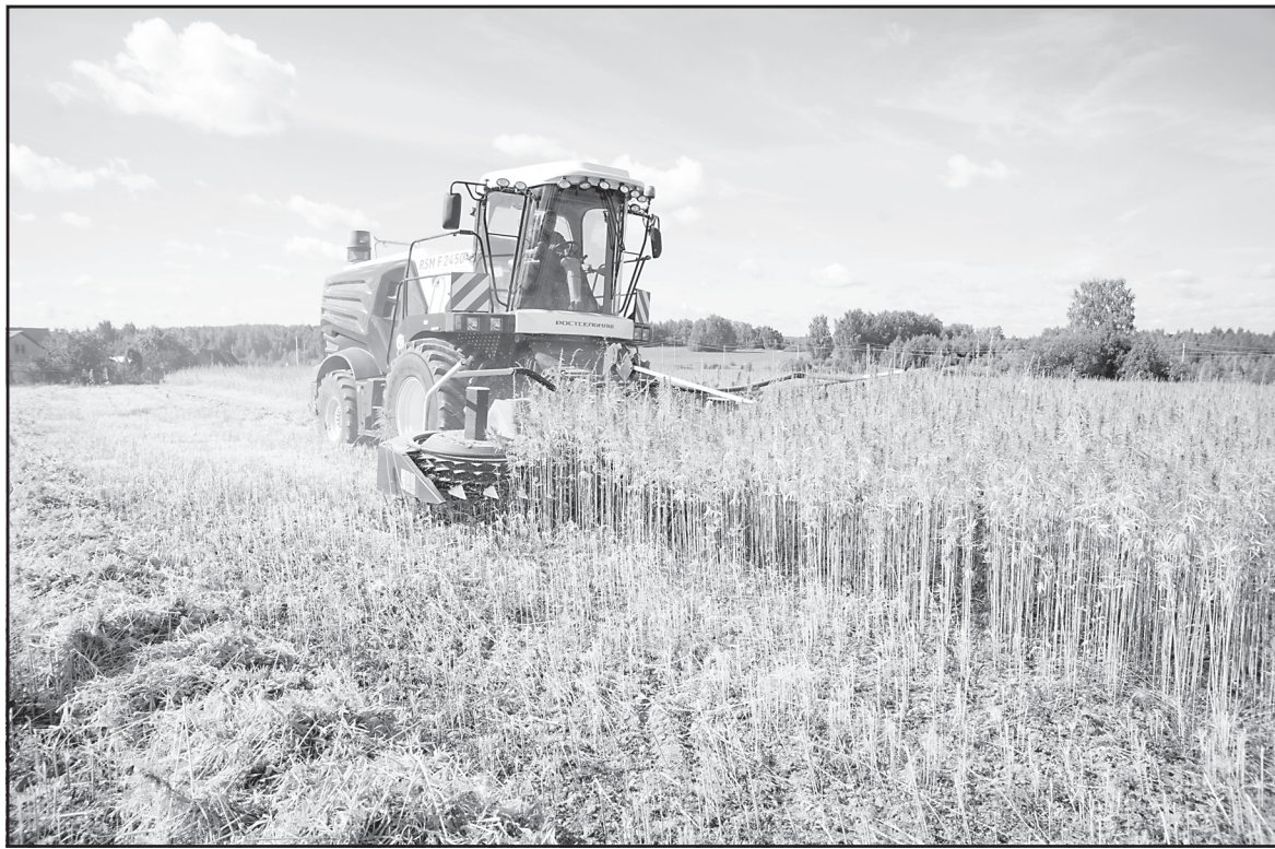
Комбайн для уборки конопли – единственный в России, работал в прошлом году на полях Палехского и Лухского районов.

Как уточнил гендиректор компании, выбор Ивановской области как места для реализации крупного инвестпроекта обусловлен целым рядом факторов: «В их числе – имеющиеся программы поддержки инвесторов, свободные земли, наличие кадров и хорошая