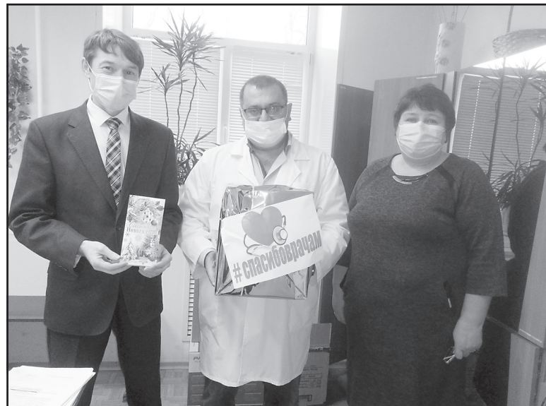
Предновогодняя акция «Спасибо врачам».