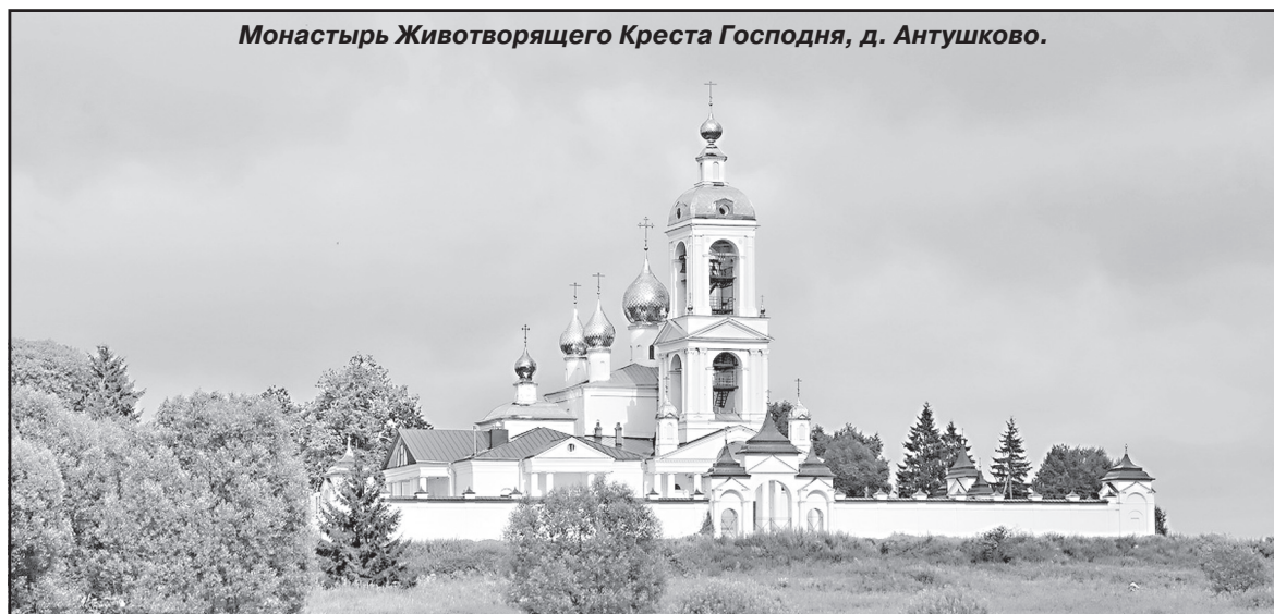
Монастырь Животворящего Креста Господня, д. Антушково.

Ильинскую землю прославили многие великие люди. Среди них - Е.Р. Дашкова - участница дворцового переворота 1762 года. Екатерина Малая, чье имение было в селе Капцеве, была в числе приведших к вла-