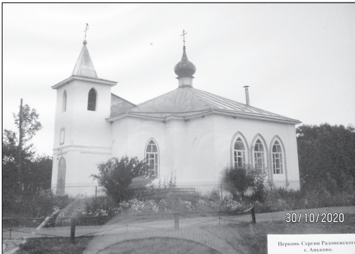
Церковь Сергия Радонежского с. Аньково.

С историей этой церкви связана легенда времен Отечественной войны 1812 года. Якобы, звонарю, звавшему звоном колоколов к вечерней службе, открылась в лучах заката картина «на воздуши», то есть в воздухе. Звонарь отчетливо видел