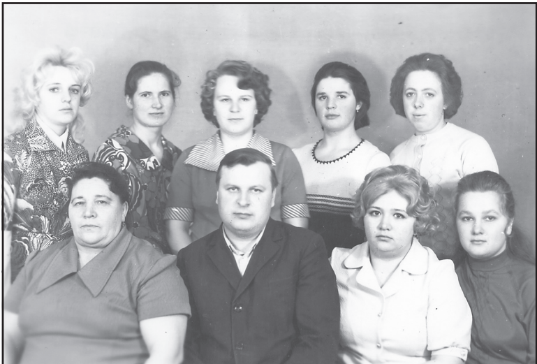
Коллектив Ильинского гастронома, апрель 1978 год.