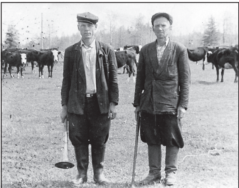
Пастухи колхоза «Россия», 1960 год.