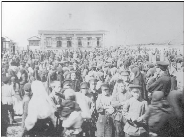
Проводы молодёжи на Русско-Японскую войну.