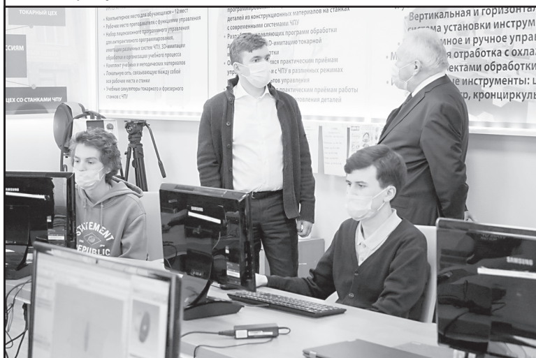
По материалам официального сайта Правительства Ивановской области.

«С одной стороны, у нас рабочих мест не хватает, но, с другой стороны, тот же «Автокран» жалуется, что кадров нет. И просят, чтоб увеличили приём наши колледжи и побольше готовили кадры под наши предприятия. Сейчас в этом есть определенный дисбаланс», - отметил Станислав Воскресенский. Губернатор рассказал, что машиностроительные предприятия в регионе активно модернизируют производство. «Планы у них большие. Но главное - они не на бумаге, а реально их реализуют. Стараемся, чтоб и другие наши действующие предприятия расширились», - рассказал глава региона. Станислав Воскресенский пожелал студентам колледжа успешно доучиться, отслужить в армии и обязательно вернуться на малую родину. «Возвращайтесь в Ивановскую область, вы нам очень нужны», - подчеркнул он.