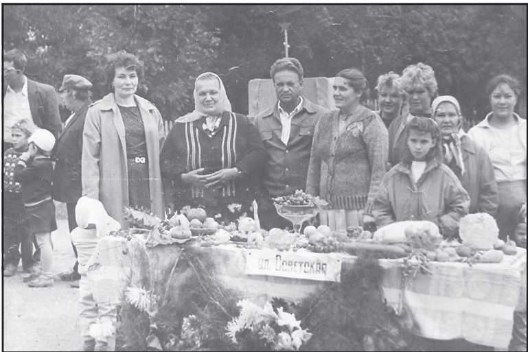
День села Нажерова, 1980 год.