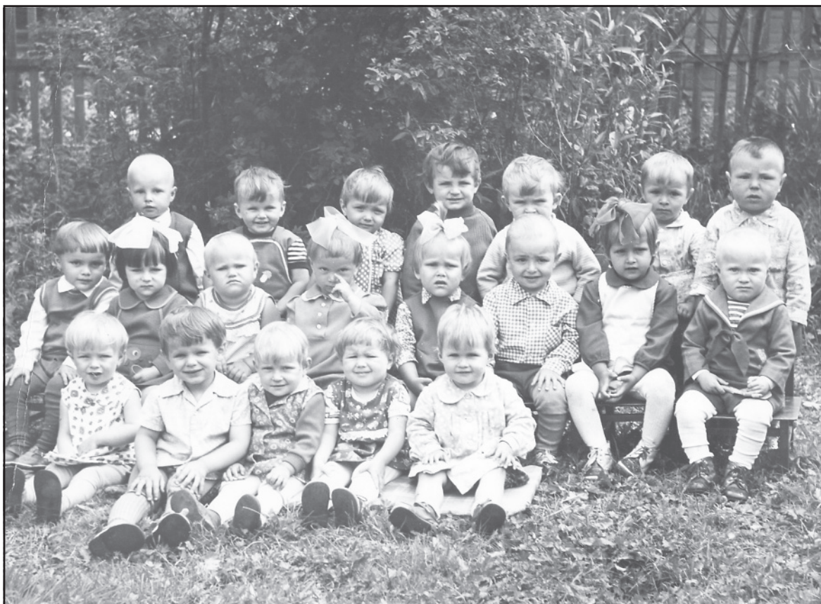
Воспитанники Ильинских яслей, 1979 год.