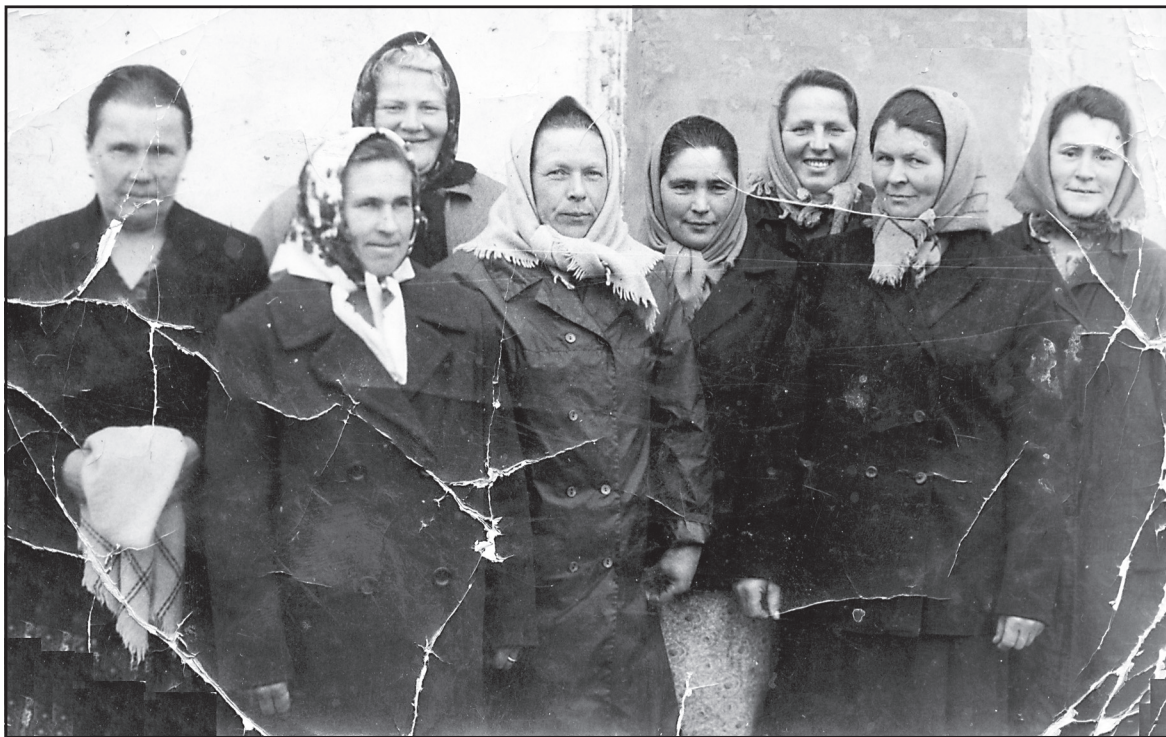
Животноводы д. Шумятино, 1978 год.