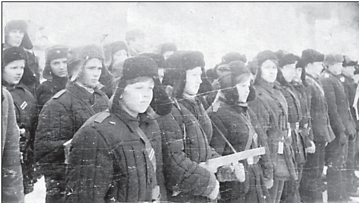
Военизированная игра Зарница, Ильинский район, 1970-е годы.