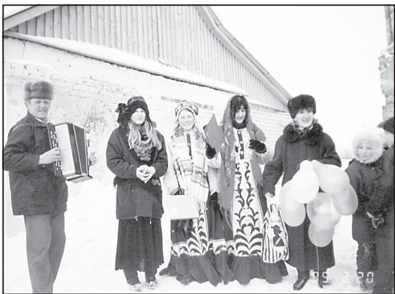
Масленица в Кулачевской школе, 1999 год.