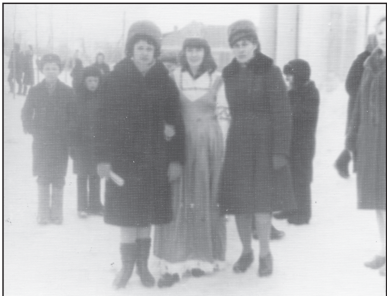
Проводы Русской зимы, п. Ильинское, 1966 год.