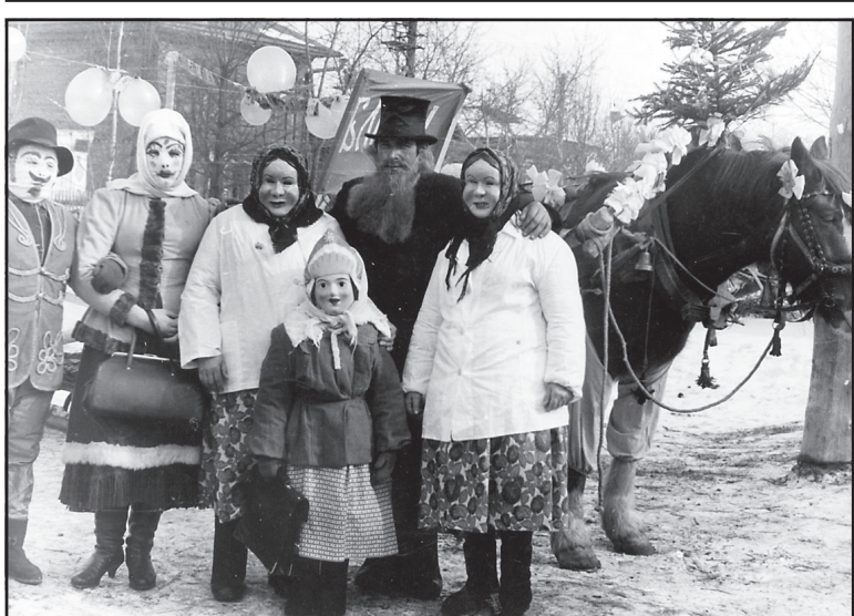
Масленица, п. Ильинское, 1960-е - 1970-е годы.