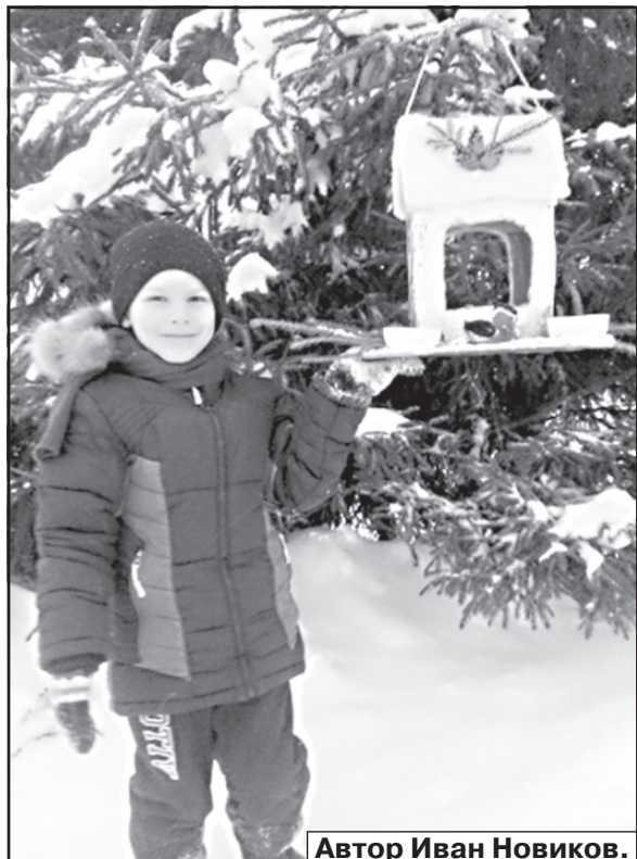
Автор Иван Новиков.

Победителем в номинации «Пернатые гости» (мониторинг посетителей кормушки, фотоотчет) стала коллективная работа учащихся 5 «Б» класса Ильинской средней школы (руководитель Т.А. Малахова). Призе-