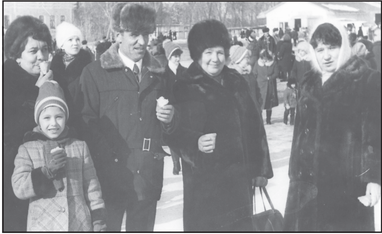
Проводы Русской зимы, п. Ильинское, 1989 год.