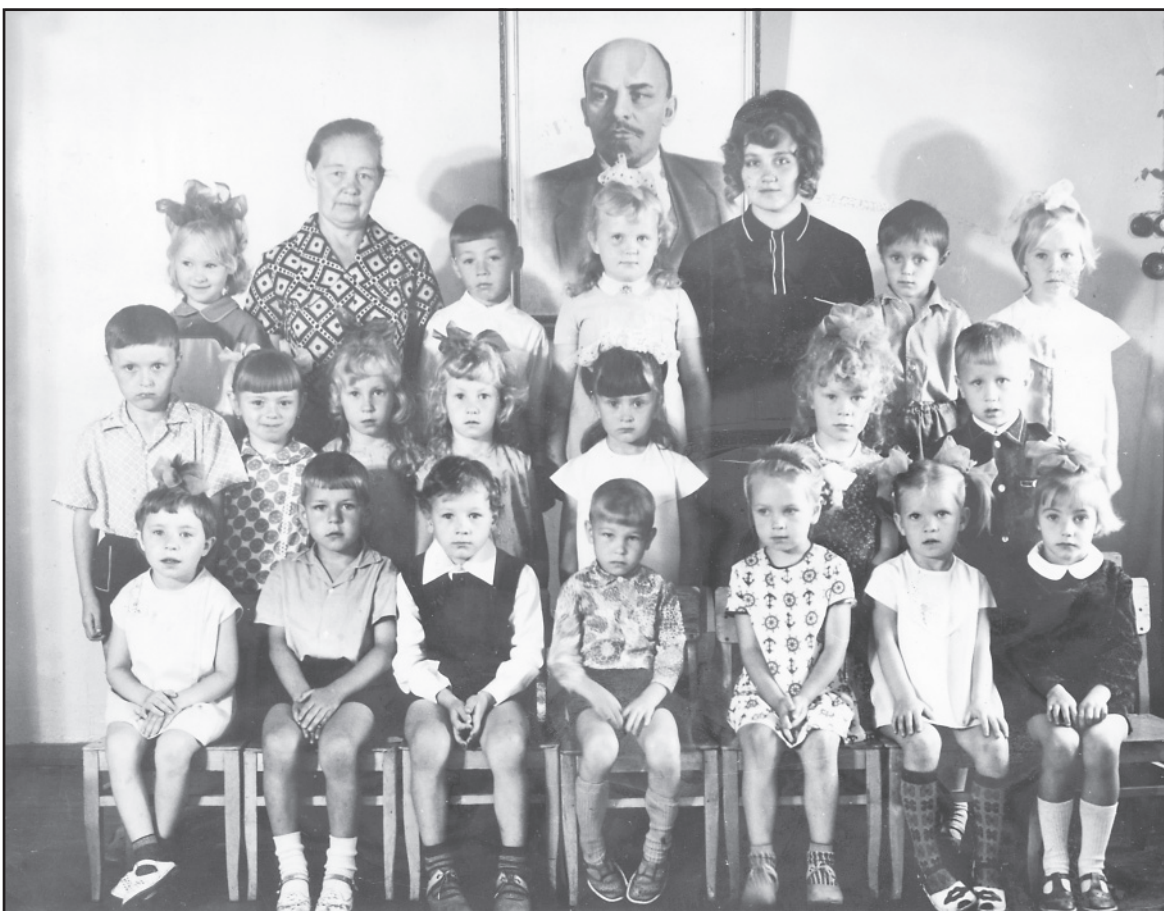
Ильинский детский сад, старшая группа, конец 1970-х годов.