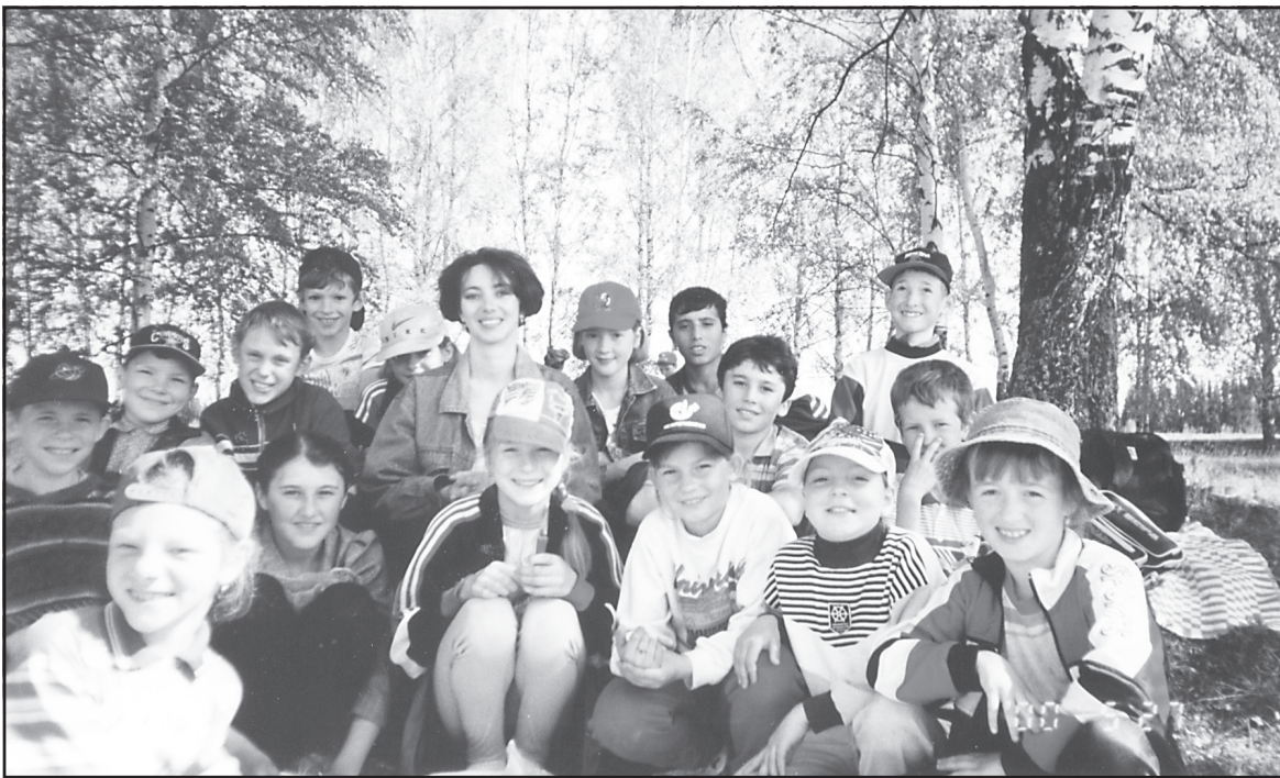
В походе! Учащиеся начальных классов Ильинской школы, май 2000 год.