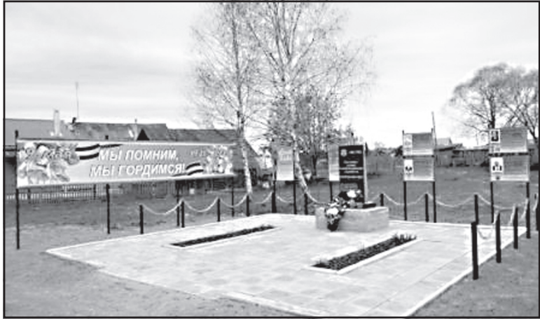
В рамках программы «Формирование современной городской среды» в 2020 году установлен памятник участникам Великой Отечественной войны и труженикам тыла в д. Щенниково.

Проект «Формирование комфортной городской среды» реализуется с 2017 года. Множество территорий получили новую жизнь в разных городах и поселениях России. В Ильинском муниципальном районе в д. Щенниково в 2020 году установлен памятник участникам Великой Отечественной войны и труженикам тыла.