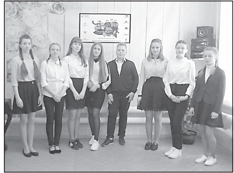
Участники конкурса чтецов «Живая классика»

Все победители, призеры и участники конкурса, а также руководители, подготовившие детей к муниципальному этапу конкурса, будут награждены дипломами, сертификатами и