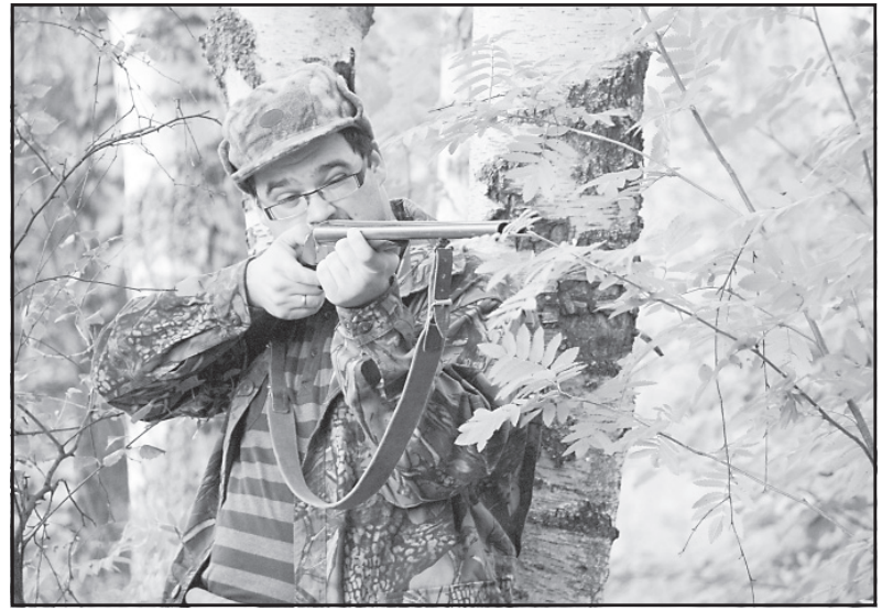
Капканам ивановские охотники предпочитают ружья.

– У каждого охотника есть свои любимые места. На