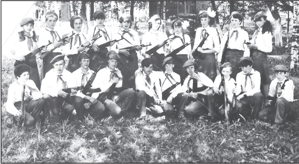
Учащиеся Ильинской средней школы на зарнице в д. Щенниково, 1984 год.