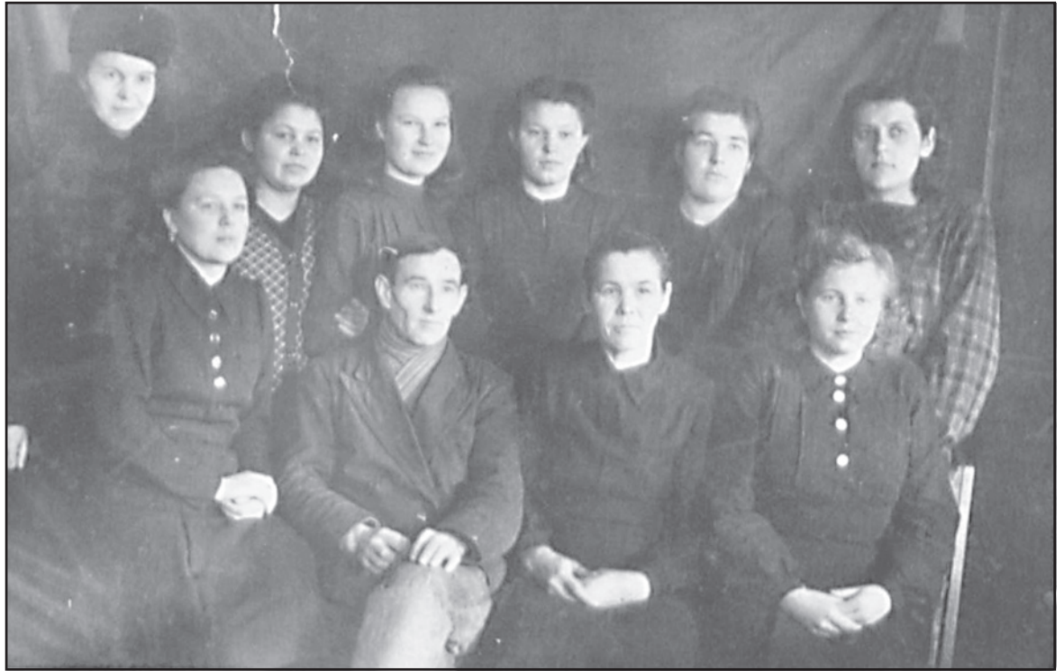
Коллектив редакции газеты «Звезда», 1948 год.