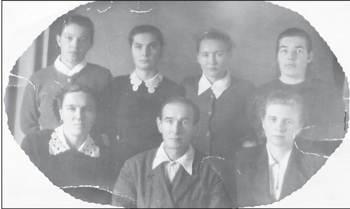
Коллектив редакции и типографии, п. Ильинское, 1948-1950 годы.