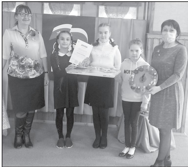
Награждение победителей конкурса.

Победителю конкурса «Русская матрёшка» - детскому творческому коллективу дома ремёсел был вручен диплом победителя и картина для рисования по номерам. Два другие коллектива получили сертификаты участников.