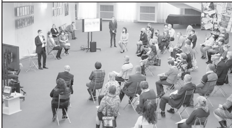
По материалам официального сайта Правительства Ивановской области.

«Есть много федеральных программ, по которым можно эффективно развивать село. Застарелая проблема - давно людям обещали - дорога Жажлево-Ильинское будет сделана именно по программе комплексного развития села. По разным программам строятся детские и спортивные площадки, идет благоустройство», - подчеркнул губернатор Станислав Воскресенский. Он также остановился на реализации программы газификации по линии Газпрома и Министерства сельского хозяйства РФ, вводе земель в оборот. Глава региона в формате диалога обсудил с активными жителями актуальные направления развития сельских территорий в регионе, а также ответил на волнующие сельчан вопросы.