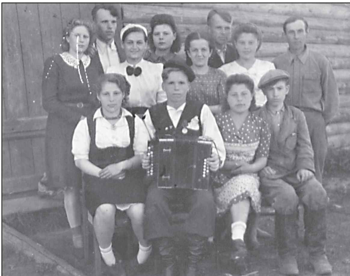
Коллектив редакции и типографии, п. Ильинское, май 1947 год.