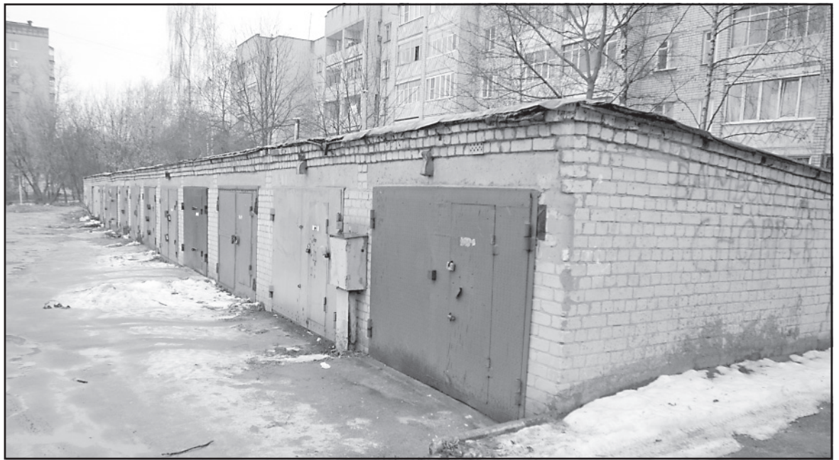
Если гаражи используются по назначению, их можно оформить в собственность бесплатно.

«В законе прописан механизм упрощенного бесплатного оформления прав на соответствующие гаражи и одновре-