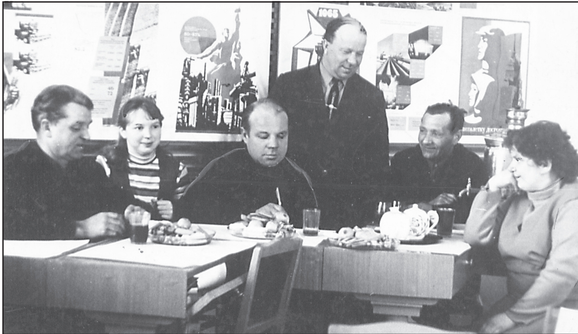
Встреча за «круглым столом» с передовиками сельского хозяйства в редакции газеты «Звезда».