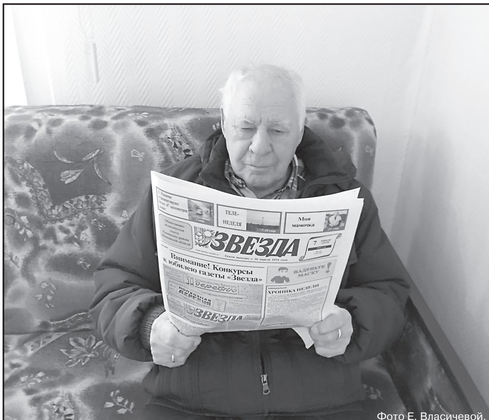
Фото Е. Власичевой.

Мы будем обязательно двигаться вперёд и искать новые формы работы, вести диалог с нашим читателем. Сегодня это непросто, но перо журналиста не должно притупляться и, в первую очередь, потому, что именно мы пишем историю Ильинского района и рассказываем о жизни и достойных