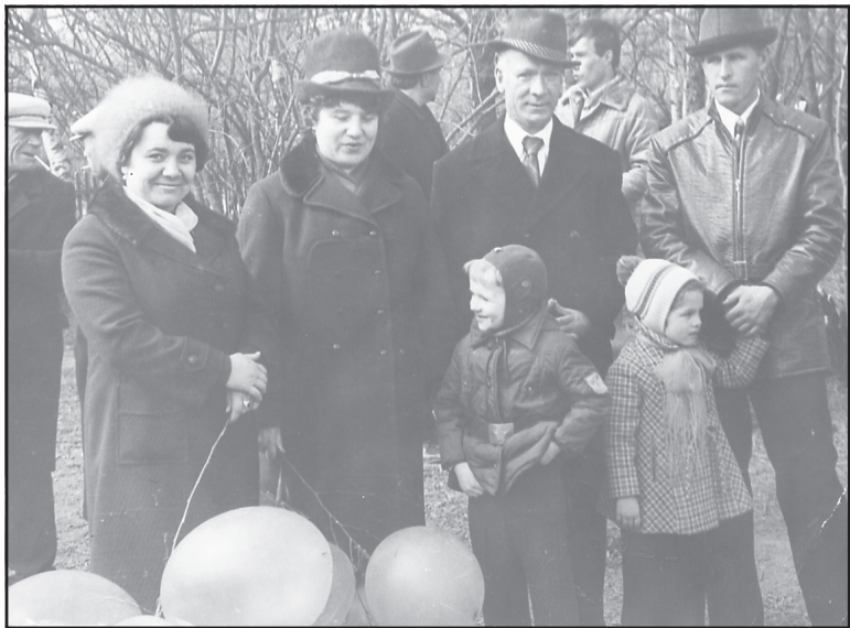
Празднование 1 Мая, Аллея Героев, п. Ильинское, 1978 год.