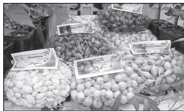
По материалам Россельхознадзора.

Благодаря своевременно принятым мерам предотвращен ввоз карантинных сорных растений на территорию Ивановской области и их распространение в регионе.