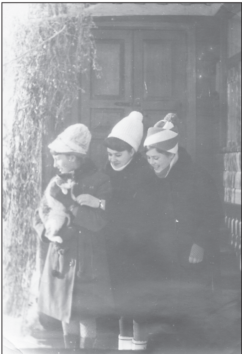
Подруги, п. Ильинское, 1980-е годы.