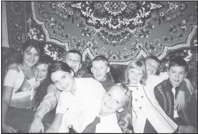
Весёлая компания, п. Ильинское, 2008 год.