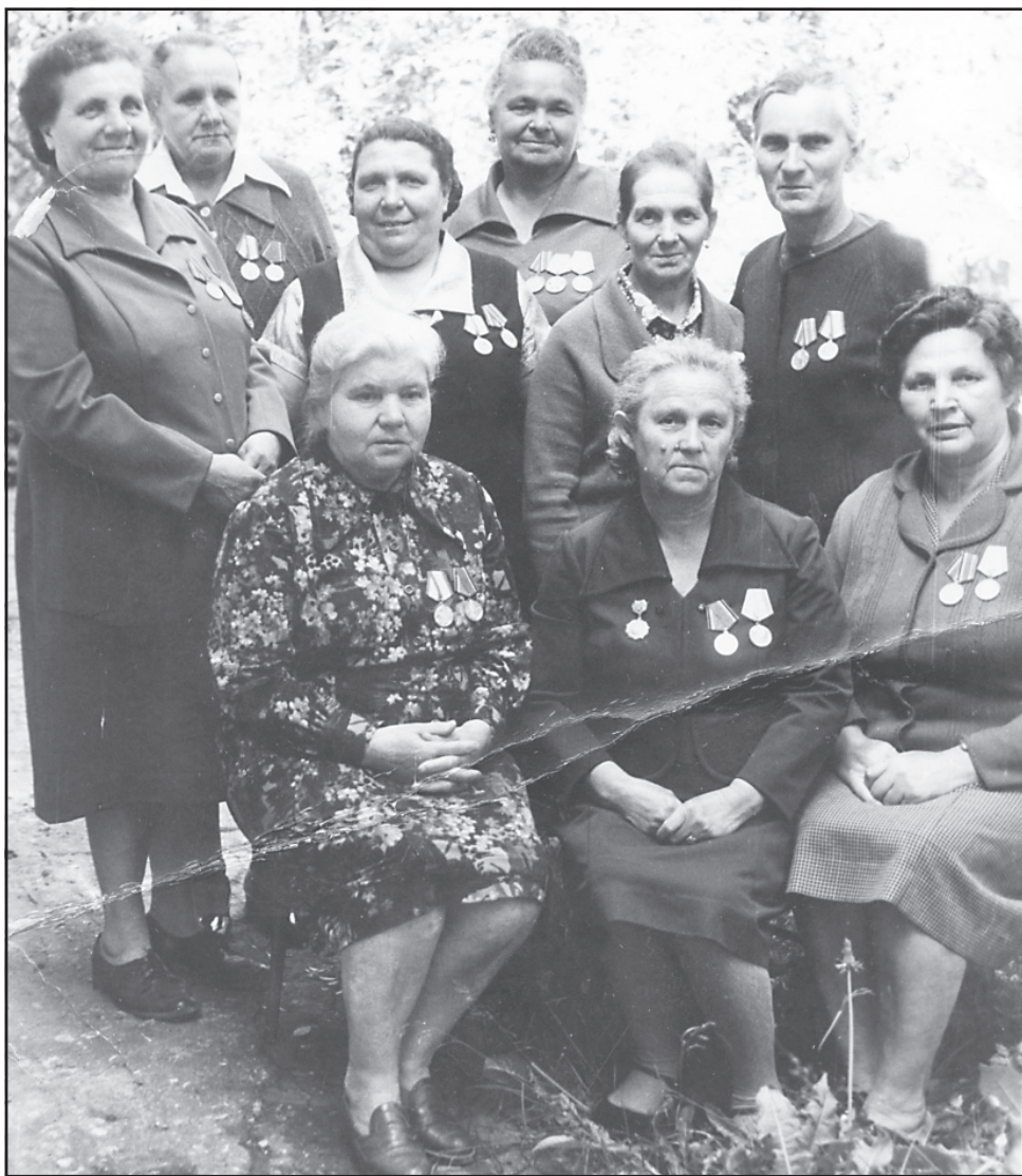
Участницы Великой Отечественной войны, п. Ильинское, 1980-е годы.