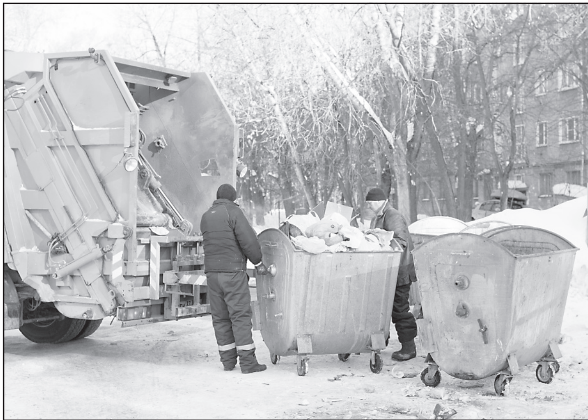
Только 26% россиян сортируют мусор и 33% сдают опасные отходы.