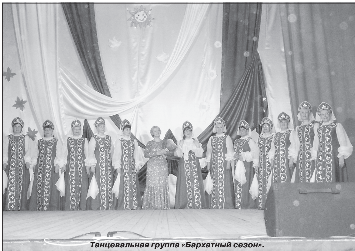
Танцевальная группа «Бархатный сезон».

Вспоминаю и то, как несколько лет подряд при Гарском ДК работало любительское объединение «Танцпол». Его посещали женщины, как